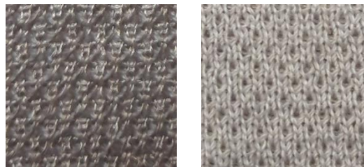
Rys. 5. Dzianina D2

Dzianina D2 to rzadkowa dzianina dwuwarstwowa, o masie powierzchniowej 281 \text{ g/m}^2 i grubości 1,22 mm, której jedna warstwa wykonana jest z ciągłych posrebrzanych włókien poliamidowych dtex110f34, a druga z mieszankowej przędzy poliestrowej z 20% udziałem odcinkowych włókien stalowych tex20x2 (Rys. 5). Zawartość włókien przewodzących w dzianinie wynosi odpowiednio dla włókien poliamidowych posrebrzanych 64,3 \text{ g/m}^2 (22,9%) a dla włókien stalowych 43,3 \text{ g/m}^2 (15,5%).