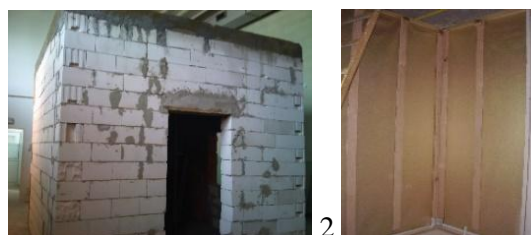
Rys. 3. Pomieszczenie budowlane „domek modelowy” (1) z przykładowym sposobem montażu włókninowych materiałów wewnątrz pomieszczenia (2)

W celu potwierdzenia wyników badań laboratoryjnych wykonano badania w warunkach modelowych - w specjalnie przygotowanym pomieszczeniu budowlanym („domku modelowym”). Wytypowane metalizowane włókniny o najlepszych właściwościach tłumiących pole elektromagnetyczne umieszczono na odpowiednio przygotowanym podłożu każdej ze ścian wewnątrz pomieszczenia (Rys. 3-5). Po zamontowaniu materiałów przeprowadzono pomiary tłumienia pola elektromagnetycznego dla wybranych częstotliwości.