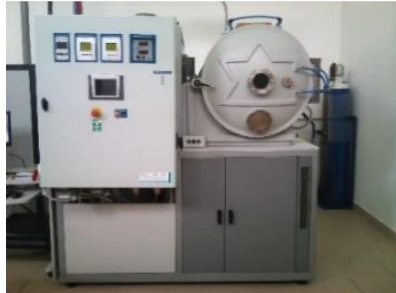
Rys. 1. Urządzenie do nanoszenia powłok metalicznych na materiały włókiennicze metodą rozpylania magnetronowego

budowa urządzenia do tego celu powstała w Instytucie w ramach Projektu Envirotex współfinansowanego przez EPRR PO IG. Urządzenie to umożliwia nanoszenie cienkich powłok na różne materiały włókiennicze o szerokości 60cm i długości do 10 metrów w układzie „roll to roll” (Rys. 1). Metoda rozpylania magnetronowego jest metodą suchą, co jest zaletą ze względów środowiskowych (brak odpadów i zanieczyszczeń chemicznych).