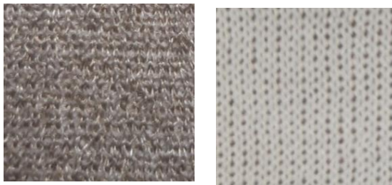
Rys. 4. Dzianina D1

Dzianina D1 to rzadkowa dzianina dystansowa dwuwarstwowa, o masie powierzchniowej 153 \text{ g/m}^2 i grubości 1,06 mm, w której jedna warstwa utworzona jest z ciągłych posrebrzanych włókien poliamidowych dtex110f34, a druga z ciągłych włókien poliestrowych dtex167f32. Warstwy połączone są multifilamentową przędzą poliamidową dtex33f10 (Rys. 4). Zawartość włókien przewodzących w dzianinie wynosi 62 \text{ g/m}^2 (40,5%).