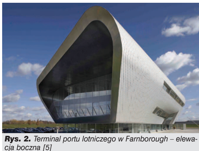
Rys. 2. Terminal portu lotniczego w Farnborough – elewacja boczna [5]

Niczym rzeźba obiekt ten przyjmuje różny wygląd w zależności od miejsca obserwacji, co widać, gdy porówna się jego elewacje pokazane na rysunkach 1 i 2. Bryła budynku o wydłużonym kształcie, lekko załamana w połowie długości swą charakterystyczną formę zawdzięcza płynnemu przejściu ścian w dach.