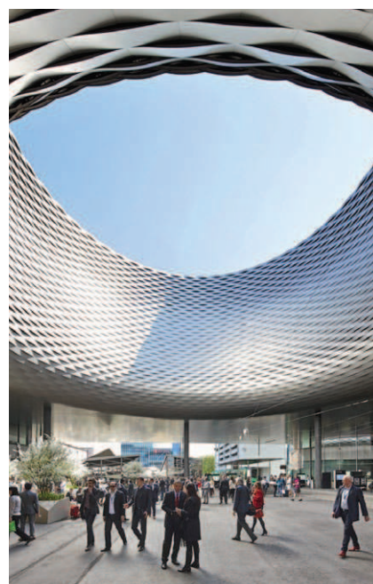
Rys. 8. Atrium centrum wystawowego New Hall Messe w Bazylei – widok ogólny [10]