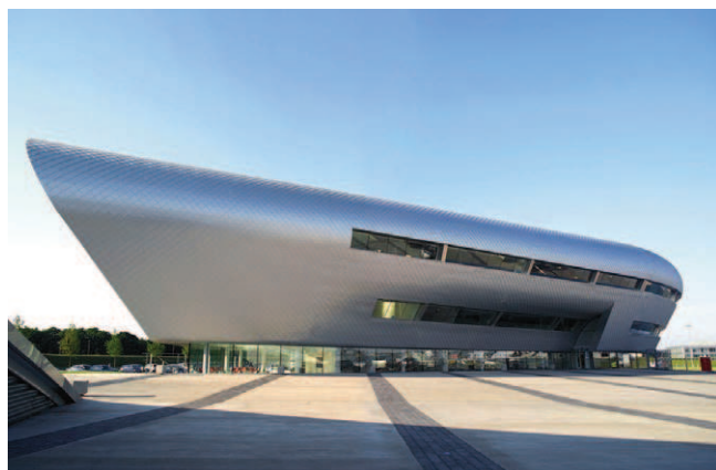
Rys. 1. Terminal portu lotniczego w Farnborough – widok od strony płyty lotniska [4]

Niewątpliwie motywem przewodnim towarzyszącym projektowi terminalu portu lotniczego w Farnborough w Wielkiej Brytanii była tematyka awiacyjna, bo wizja architektoniczna zmaterializowała się w obiekcie imitującym skrzydło samolotu niejako unoszące się nad poziomem terenu (rys. 1).