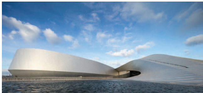
Rys. 4. Akwarium Blue Planet w Kopenhadze – widok ogólny [7]