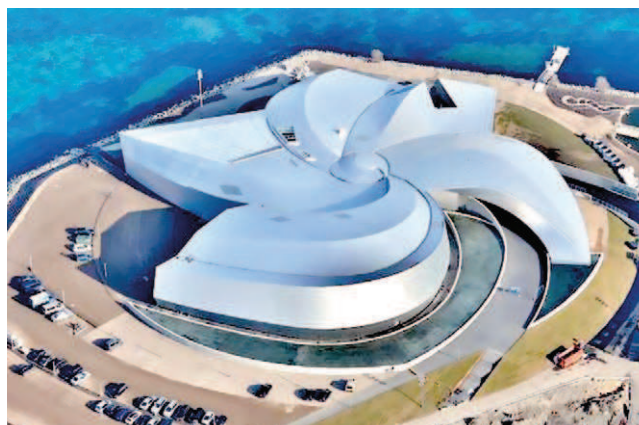
Rys. 3. Akwarium Blue Planet w Kopenhadze – widok z lotu ptaka [6]

Od długiego już czasu w architekturze światowej można zaobserwować trend, w którym urzeczywistniają się najbardziej fantastyczne wizje architektów, niemożliwe do realizacji kilkadziesiąt lat temu, przede wszystkim