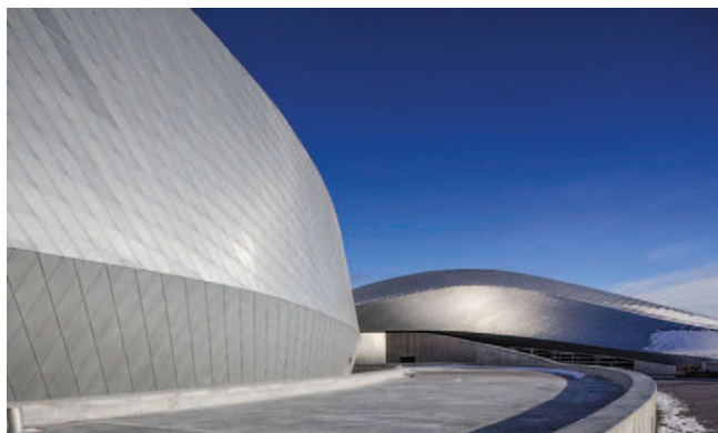
Rys. 5. Akwarium Blue Planet w Kopenhadze – widok elewacji [8]

płynnej i gładkiej elewacji, która nadała bardzo dynamiczny charakter całemu obiektowi (rys. 4 i 5). Interesujące efekty wizualne są obserwowane w różnych porach dnia i roku dzięki różnym efektom świetlnym i kolorystycznym, związanym z oświetleniem i odbijaniem światła przez płyty aluminiowe i otaczające obiekt morze.