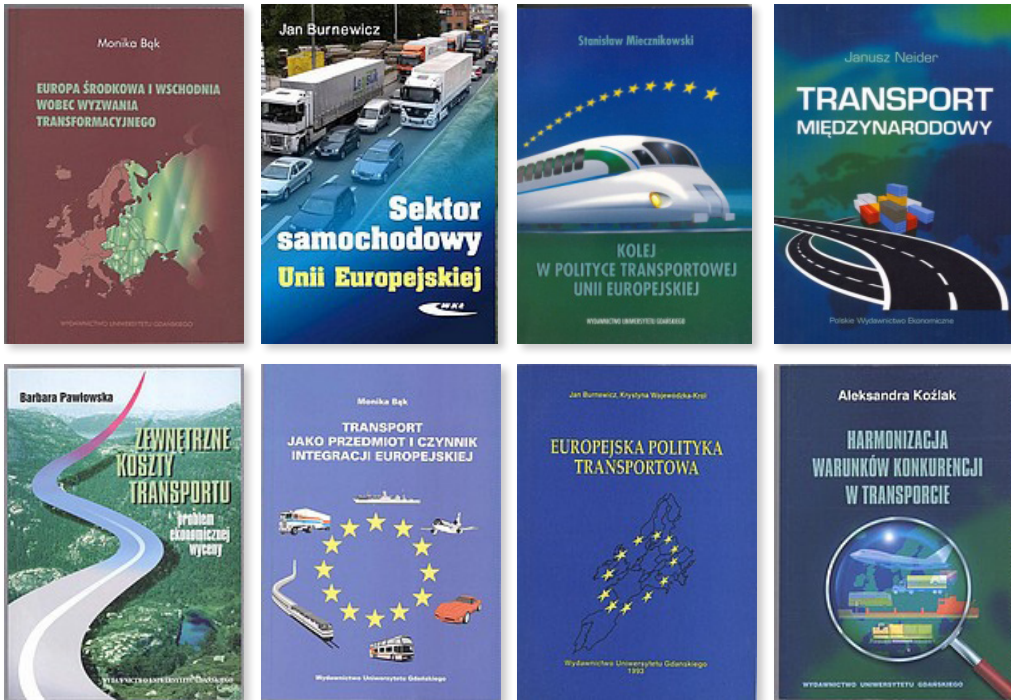
Rysunek 4. Wybrane publikacje dotyczące transportu UE

W tej dziedzinie dorobek pracowników szkoły sopockiej jest szczególnie duży, dzięki uczestnictwu w licznych programach unijnych, takich jak: