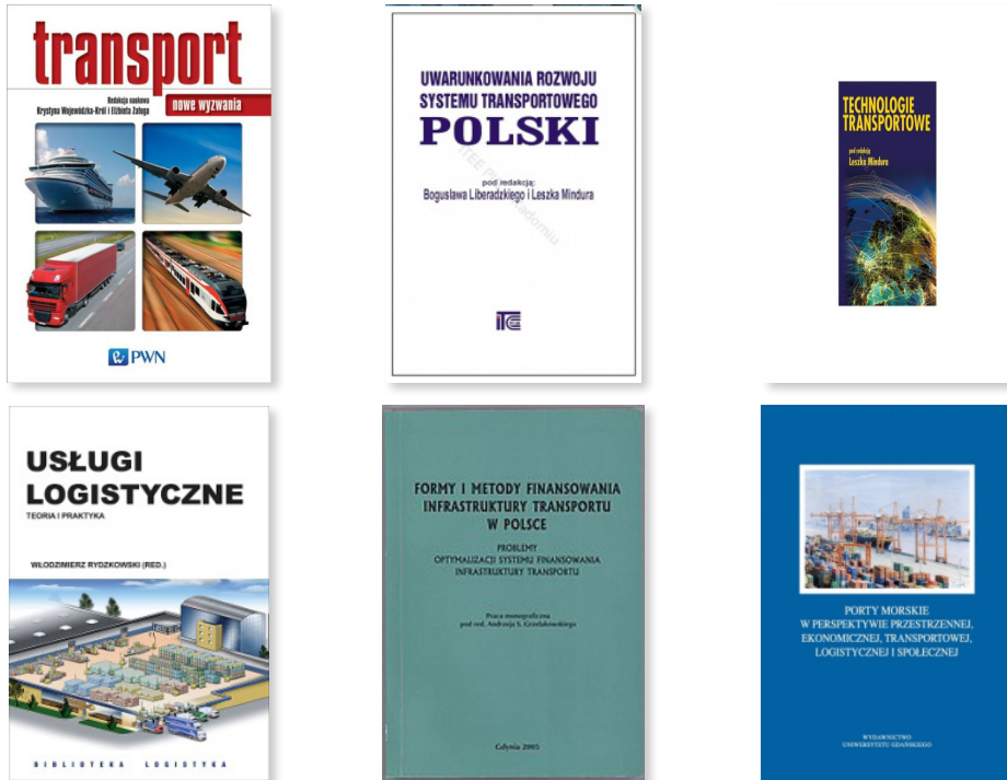
Rysunek 5. Wybrane publikacje przygotowane wspólnie przez różne ośrodki naukowe

Sopocka szkoła transportowa wpłynęła w istotny sposób nie tylko na region, ale również na rozwój kadr w Polsce i Unii Europejskiej. Nasi absolwenci są prezesami największych przedsiębiorstw transportowych, pełnią ważne funkcje w administracji samorządowej i krajowej, a także reprezentują Polskę w strukturach Unii Europejskiej.