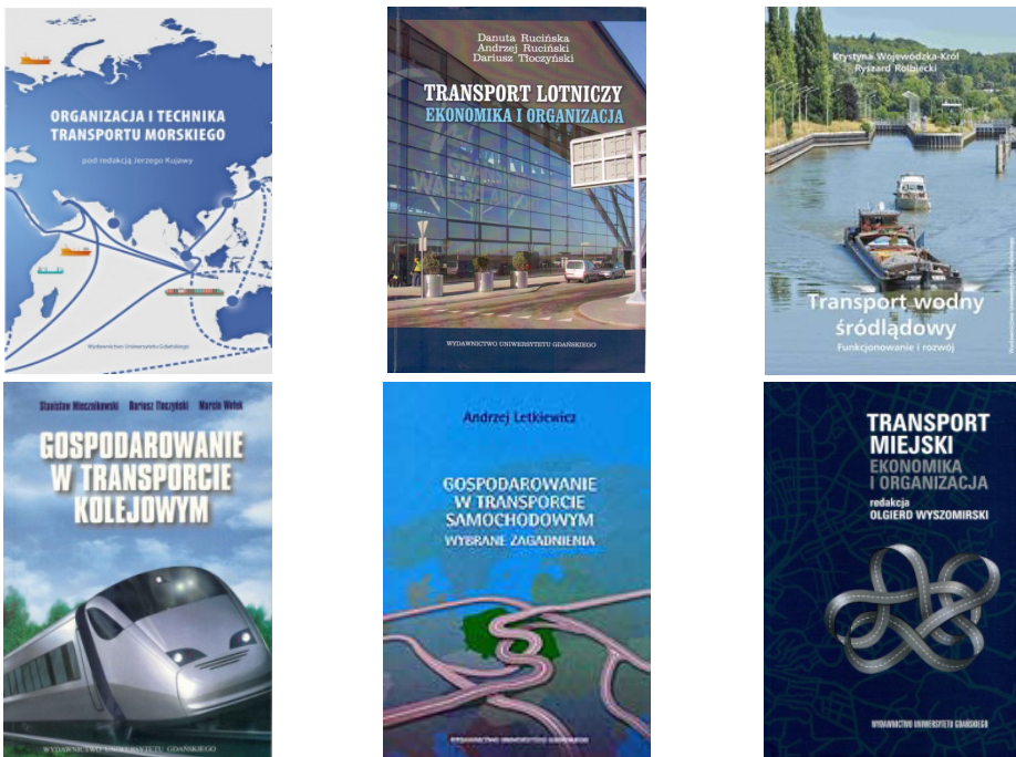
Rysunek 2. Wybrane monografie dotyczące gałęzi i rodzajów transportu autorstwa pracowników Uniwersytetu Gdańskiego

Charakter morski od początku istnienia uczelni zawsze był w sopockiej szkole transportowej bardzo widoczny, z czasem jednak wzbogacono badania o inne gałęzie transportu: transport kolejowy, samochodowy i wodny śródlądowy, co znalazło swoje odzwierciedlenie w strukturach organizacyjnych. Z czasem badania poszerzono o transport lotniczy i miejski. Pomimo zmian organizacyjnych i rozwoju nowych kierunków badań, problemy gałęziowe nadal w Sopocie stanowią ważny dorobek naukowy i dydaktyczny, który znajduje swój wyraz w kolejno publikowanych monografiach (rys. 2).