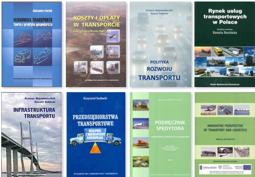
Rysunek 3. Wybrane książki dotyczące problemów ogólnotransportowych

Z czasem silniejszy akcent przeniesiono z zagadnień gałęziowych na problemy ogólnotransportowe. Badania dotyczyły zarówno podstaw teoretycznych rozwoju funkcjonowania i rozwoju transportu, jak i bieżących problemów transportu oraz prognozowania rozwoju transportu. Uwieńczeniem ich były kolejne książki, prezentujące wyniki prowadzonych badań, stanowiące podstawę kształcenia ekonomistów transportu i wspierające przedsiębiorstwa transportowe i administrację w tym zakresie. Były to opracowania dotyczące między innymi ekonomiki transportu, polityki transportowej, rynku transportowego, przedsiębiorstw transportowych, infrastruktury transportu oraz spedycji (rys. 3)