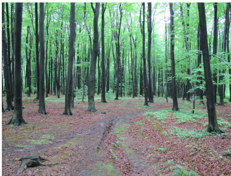
Ryc. 3. Widok na wnętrze drzewostanu bukowego.

Fig. 2. Frequency of separate tree stands in a given landscape aesthetic class in selected habitat forest types.