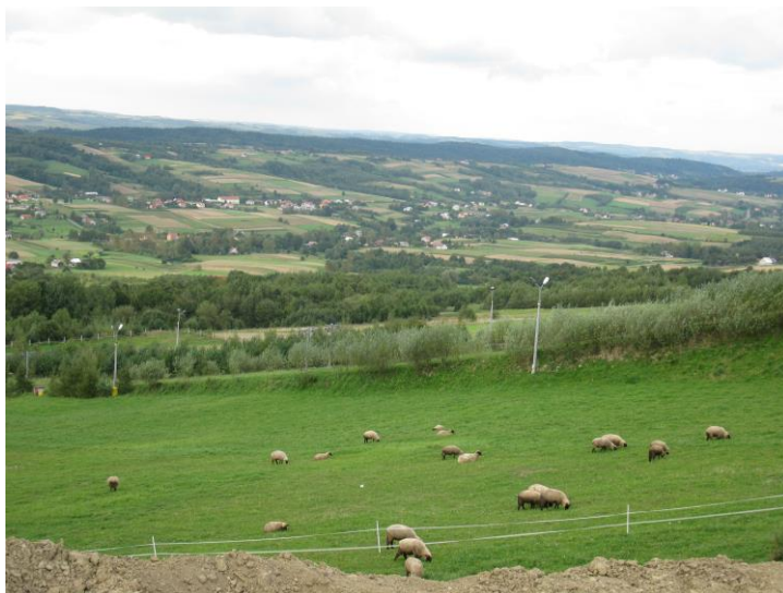
Ryc. 1. Typowy krajobraz Czar-norzecko-Strzyżowski Parku Krajobrazowego.

tych warto wymienić: dąb szypułkowy, grab zwyczajny, brzozę brodawkowatą i modrzew europejski. Flora naczyniowa Parku liczy 870 gatunków, z czego ponad 40 podlega ochronie ścisłej. Gatunki górskie stanowią ok. 7,5% całej flory Parku [10].