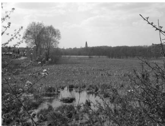
Fot. 5. Teren przeznaczony na odtworzenie Stawu Dolnego. W dali wieża kościoła Św. Barbary. Photo 5. The location of the future Lower Lake. In the background the tower of St. Barbara's Church.

Miejscowy plan zagospodarowania przestrzennego miasta Pionki został uchwalony w październiku 2003 r. Rysunek planu wykonano w skali 1:5000 – określono w nim przede wszystkim linie rozgraniczające i przeznaczenie terenów. Wyznaczono również obszary, dla których powinny zostać sporządzone plany miejscowe. Plan ten jest bardzo ogólny i w zasadzie utrzuca już istniejący układ przestrzenny z niewielkimi korektami. Ze względu na krajobraz ważne jest wyznaczenie do odbudowy Stawu Dolnego oraz przeznaczenie terenów wzdłuż Zagożdżonki na zielenie nieurządzoną, zachowując jej naturalny charakter.