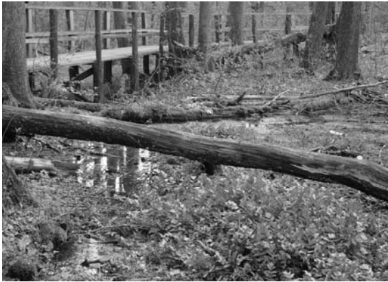
Fot. 3. Rezerwat Królewskie Źródła.

Photo 3. Nature Reserve "Krolewskie Zrodla" ("Royal Springs").