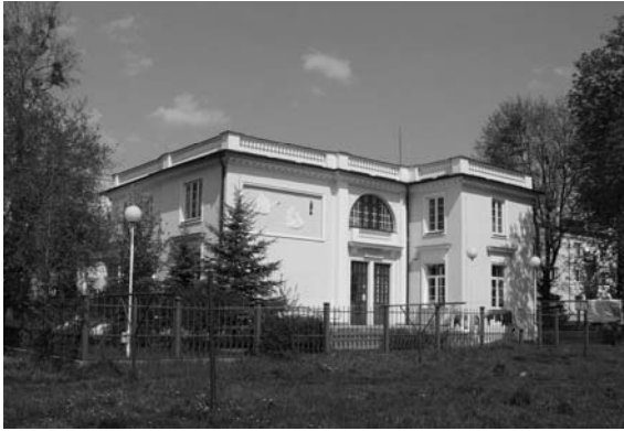
Fot. 1. Willa Pod Łabędziami. Photo 1. Villa "The Swans".