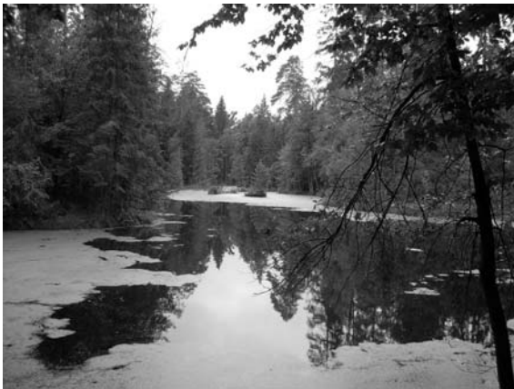
Fot. 4. Rezerwat Brzeźniczka.

Photo 3. Nature Reserve "Krolewskie Zrodla" ("Royal Springs").