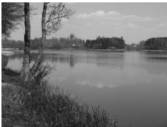
Fot. 7. Staw Górny. Photo 7. Upper Lake.

że jednym wielkich plusów miasta jest istnienie w nim skupisk drzew o charakterze leśnym oraz dużych obszarów leśnych na terenach przemysłowych.