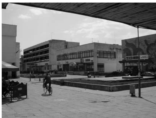
Fot. 6. Plac Konstytucji 3 Maja. Photo 6. "Konstytucja 3 Maja" Square.

Do rewitalizacji przeznaczono trzy obszary. Pierwszy obejmuje tereny najważniejsze dla miasta - jego centrum i pierwsze zabudowania przedwojennych osiedli pracowniczych, w większości tereny objęte strefą ochrony konserwatorskiej. Drugim obszarem są tereny zabudowy głównie z najwcześniejszych lat powojennych - osiedle w stylu socrealizmu. Jest to zabudowa wpisana w charakter miasta i w jego skali. Trzeci obszar to tereny oczyszczalni ścieków. W ramach tych obszarów wyznaczono kilka projektów do realizacji. Najważniejszym z nich jest Modernizacja Placu Konstytucji 3 Maja. Jest to plac obudowany zespołem budynków modernistycznych z lat siedemdziesiątych XX w. o funkcji handlowo-usługowej. Powinien on być wizytówką miasta, gdyż tu znajduje się największy hotel w mieście i wiele instytucji. Po rewitalizacji byłby to architektonicznie zaakcentowany rodzaj „ryнку” – forum miasta. Kolejne projekty to: modernizacja Alejki Spacerowej „Parku”, odbudowa Stadionu Sportowego, budowa pieszego przejścia podziemnego pod torami kolejowymi, modernizacja budynku Kasyna oraz zakup i modernizacja ciepłowni, modernizacja ogródka jordanowskiego (projekt zrealizowany), projekt modernizacji oczyszczalni ścieków.