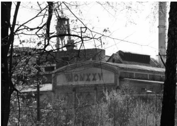
Fot. 2. Zabudowania Państwowej Wytworni Prochu. (fot. M. Agajew). Photo 2. Buildings of the State Factory of Gunpowder (photo by M. Agajew).

oraz zabudowy wsi Zagożdżon i Pionki. Pierwsze zabudowania miasta miały charakter osiedlowy i wiejski. Stopniowo powstawały obiekty użyteczności publicznej. W drugiej połowie XX w. nastąpił gwałtowny wzrost liczby mieszkańców. W Pionkach zaczęły powstawać bloki, początkowo utrzymane w charakterze niewielkiego miasteczka, a później tak jak w całej Polsce bloki z wielkiej płyty. Jeśli chodzi o układ urbanistyczny dotychczas brak w Pionkach wyraźnego centrum – rynku-forum mieszkańców. Dodatkowo to niewielkie miasto rozcięte jest na dwie części linią kolejową 1 .