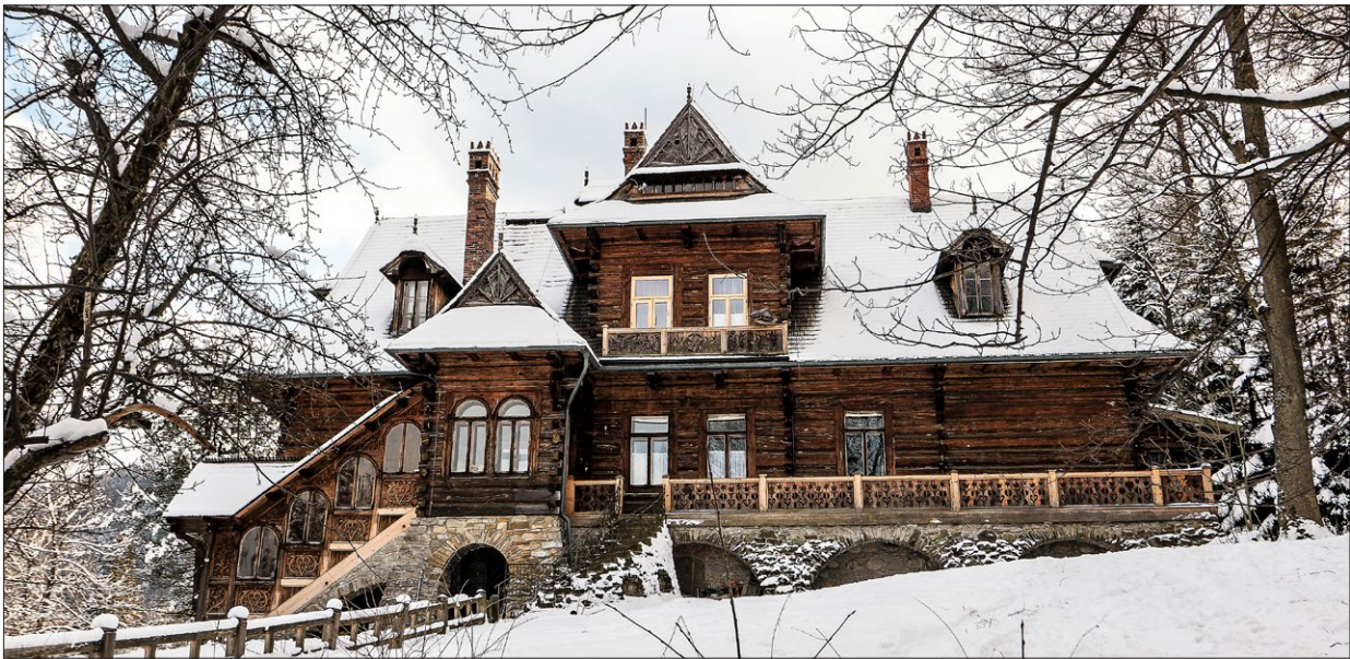
Ryc. 1. Willa „Pod Jedlami”; fot. W. Orłowski. Fig. 1. The “Pod Jedlami” Villa; photo by W. Orłowski.