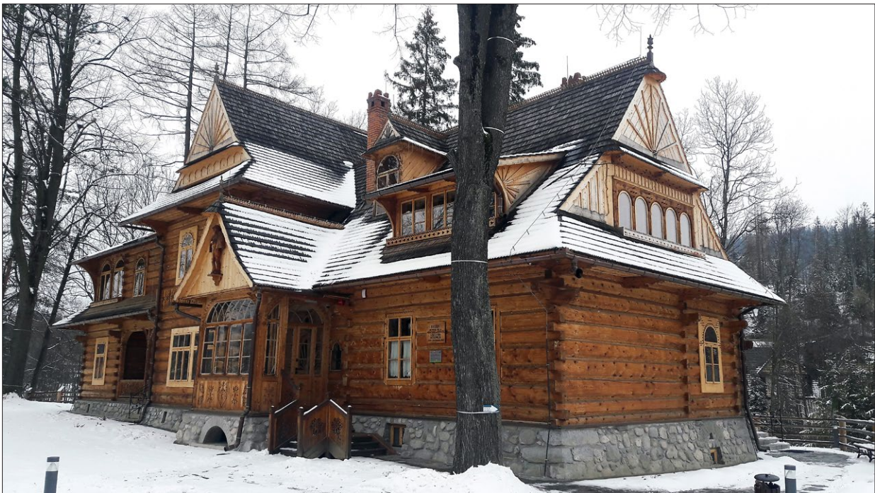
Ryc. 2. Willa „Koliba”; fot. E. Węclawowicz-Gyurkovich. Fig. 2. The “Koliba” Villa; photo by E. Węclawowicz-Gyurkovich.

z Ukrainy. W roku 1983 obiekt został wpisany do rejestru zabytków architektury, a w 1993 otwarto w nim Muzeum Stylu Zakopiańskiego. W dachu budynku Witkiewicz wprowadził tzw. wyglądy, inspirowane stosowanym w szopach góralskich, podnoszonym na drągu niedużym fragmentem dachu, aby umożliwić wyrzucanie na zewnątrz siana lub słomy 7 . W ten sposób powstawały na poddaszach w kubaturze dachu przeszklone werandy lub balkony. Później zostały zrealizowane wille „Pepita” (1893), „Oksza” i „Zofiówka” (1895–1896), czy „Pod Jedlami” (1896–1897), a także „Konstantynówka”