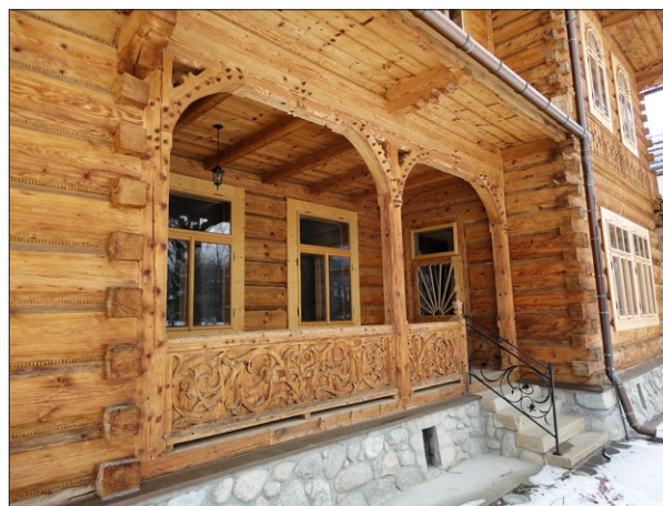
Ryc. 3. Willa „Koliba”; fot. E. Węclawowicz-Gyurkovich.

Styl zakopiański nie był jedynym poszukiwanym stylem narodowym. Style narodowe pojawiały się w krajach europejskich w XIX i na początku XX wieku