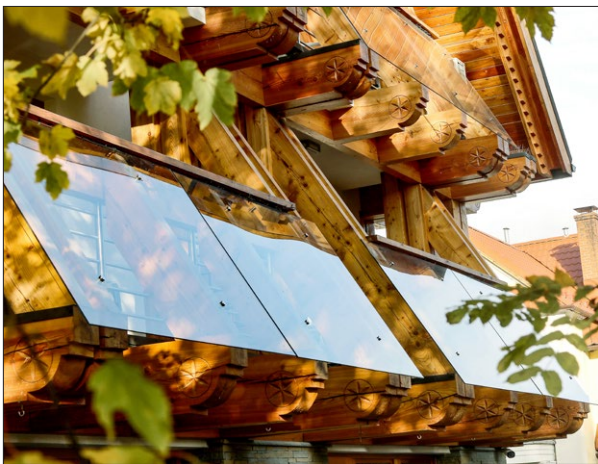
Ryc. 5–6. Pensjonat „Tatiana Boutique” w Zakopanem przy ul. Grunwaldzkiej 14B; proj. Orłowski & Krawczyński. Fig. 5–6. The “Tatiana Boutique” boarding house in Zakopane at 14B Grunwaldzka Street; design by Orłowski & Krawczyński.

a także wielorodzinnych zespołów mieszkaniowych. W tych wielkokubaturowych obiektach nawiązaniem do tradycji stają się skośne dwuspadowe dachy w różnych skalach.