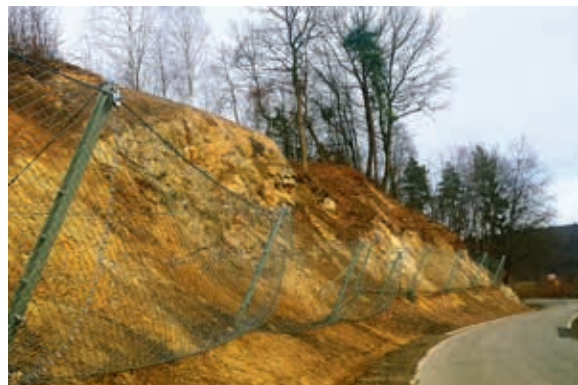
Bariera przeciwdziałkowa firmy Geobrugg AG w Kamyku