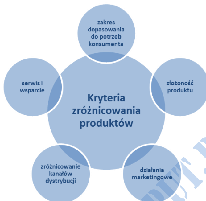
Rys. 2. Kryteria zróżnicowania produktów. Oprac. własne na podst. [6]