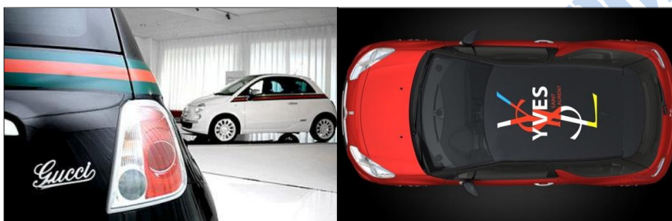
Rys. 5. Personalizowane samochody sygnowane przez światowych projektantów mody: YSL i Gucci na przykładzie Citroena DS3 i Fiata 500. Oprac. własne na podst. [11, 12]

Strategia różnicowania w przypadku logistyki polega zwykle na nadaniu usłudze transportowej odpowiednich cech nieszablonowych, przez które konsument będzie postrzegał ją jako atrakcyjną i wyjątkową [7]. Ma więc to być logistyka perfekcyjna .