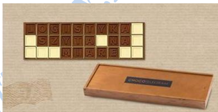
Rys. 3. Personalizowane czekoladki Chocolissimo. Oprac. własne na podst. [9]