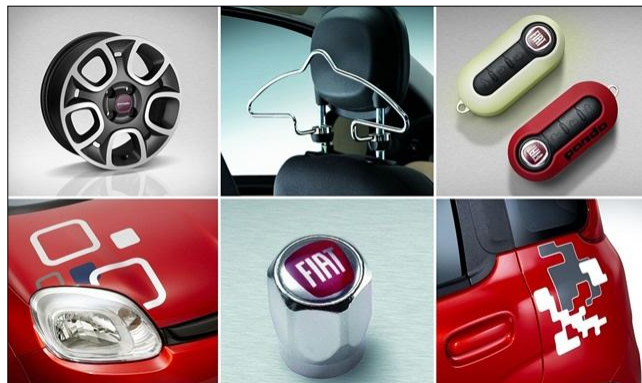
Rys. 4. Personalizowane akcesoria samochodowe na przykładzie Fiata Panda III. Oprac. własne na podst. [10]