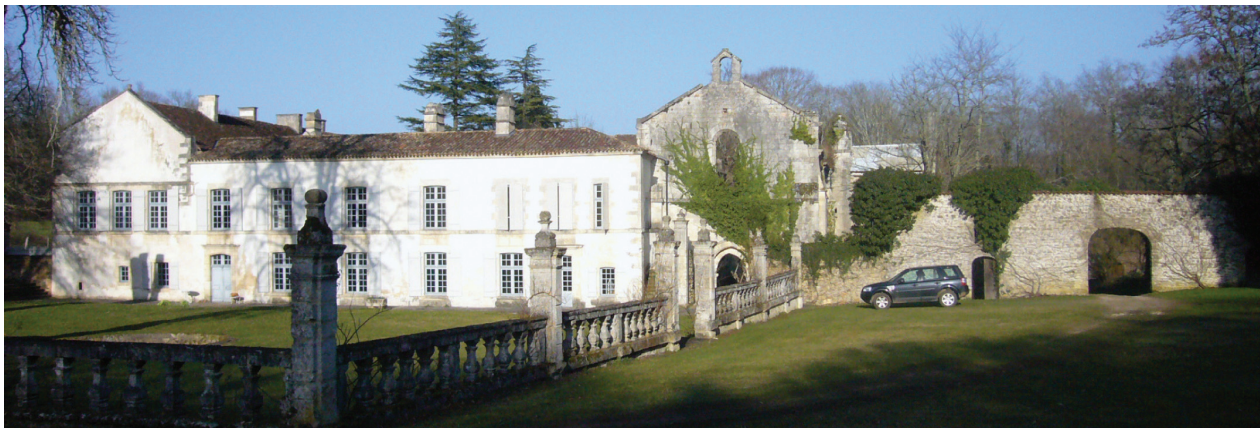
II. 4. Widok na kościół i zachodnie skrzydło klasztoru w Grosbot, 2013