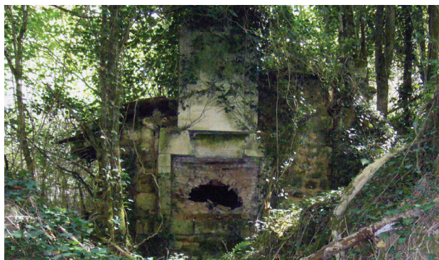
II. 5. Ruiny zabudowań folwarku na południe od opactwa Grosbot, fragment z piecem chlebowym, 2013