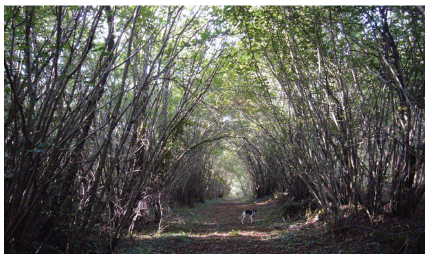
II. 6. Aleja kasztanowców w pobliżu bramy południowej opactwa, 2013