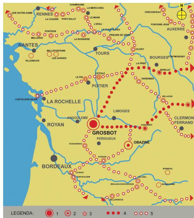
Il. 2. Fragment szlaku Via Equidia Cisterciena w południowo-zachodniej Francji: 1 – opactwo cysterskie Grosbot, 2 – opactwo cysterskie Obazine, 3 – inne opactwo cysterskie, 4 – główny szlak do Europy Wschodniej, 5 – inne trasy szlaku (oprac. J. Furgalska)

Jedną z pierwszych map, na których widnieje opactwo, jest mapa francuskiego kartografa Cassiniego z XVII w. [5, s. I]. Widoczny jest na niej ogromny zespół lasów krainy Horte, który nadał nazwę opactwu Grosbot – „Opactwo