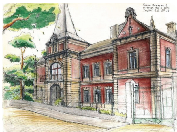
Il. 4. Szkic urbanistyczny malowniczej willi (ul. Samchuka 6) (tusz, kolorowe kredki, rys. student 3. semestru V. Holubyev, 2014)

Willa stała się wiodącym stylem budownictwa w stylu „pittoresco” (lata 90. XIX w.), ponieważ dawała możliwość ukazania wszystkich trendów związanych z użyciem