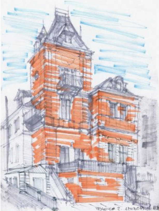
Il. 3. Szkic urbanistyczny „willi rodziny Bromilskij”, historycyzm z elementami stylu ojczystego (flamaster, rys. student 3. semestru – V. Kryvoruchko, 2014)