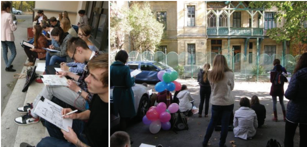
Il. 1. Studenci architektury szkicują wille Lwowa, 2012–2014