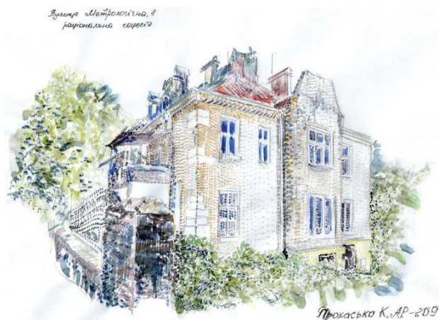
Il. 7. Szkic urbanistyczny willi secesyjnej (ul. Metrolohichna 8) (akwarela, pióro, ołówek, rys. student 3. semestru K. Prohasko, 2013)