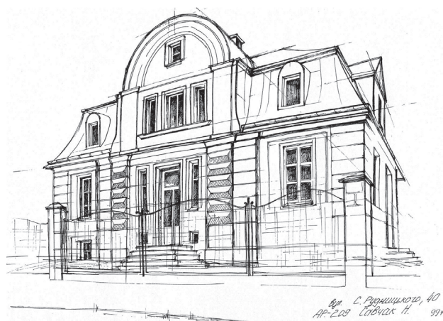
Il. 8. Szkic urbanistyczny willi w stylu art déco (ul. Rudnytskoho 40) (tuszczyk, rys. student 3. semestru N. Savchak, 2012)