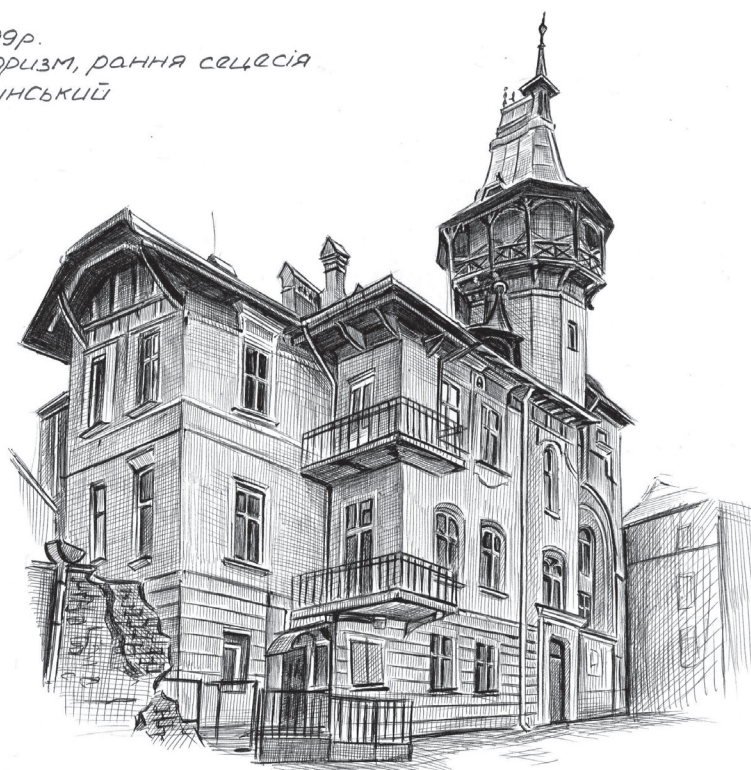
Il. 5. Szkic urbanistyczny willi I. Dolynskiego (pióro, rys. studentka 3. semestru I. Makovska, 2013)

Вилла 1899р. Пізній історизм, рання сецесія Арх. Я. Долінський