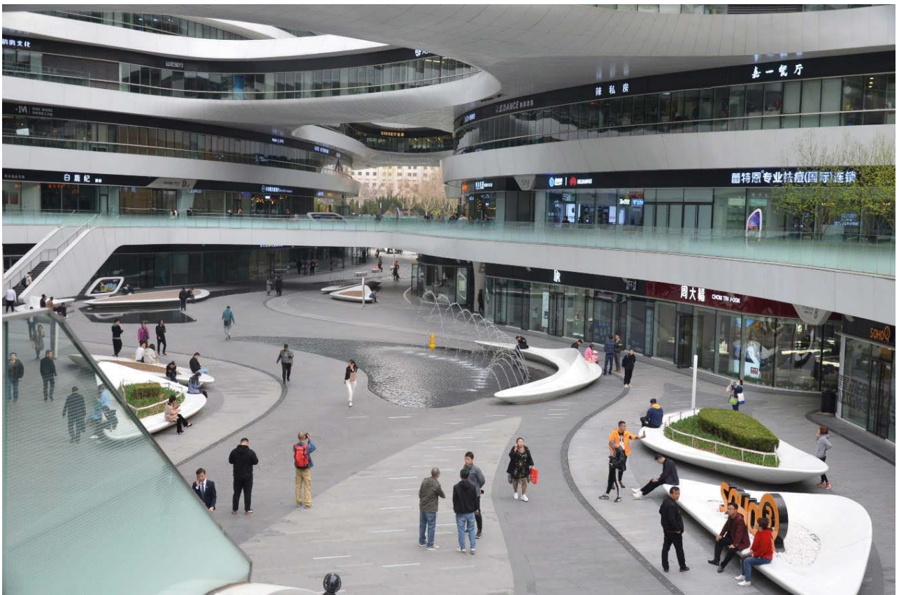
II. 4, 5, 6. Pekin — Centrum biurowo-handlowo-rekreacyjne GALAXY SOHO (fot. W. Kosiński).