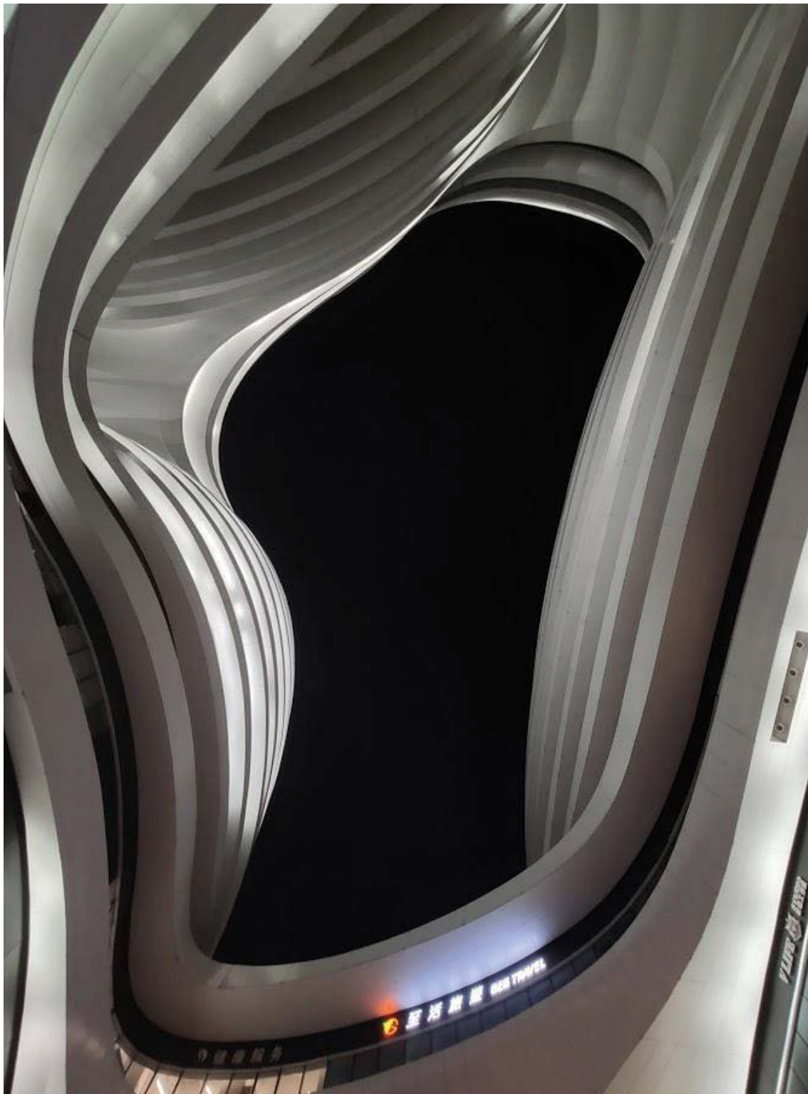
II. 7, 8, 9. Pekin — Centrum GALAXY SOHO nocą.