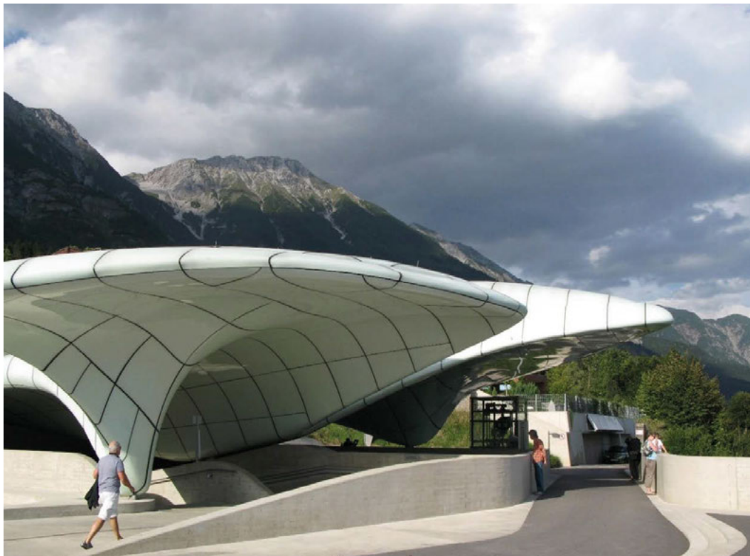
II. 3. Innsbruck — ostatni przystanek (Hungerburg Station) kolejki szynowej na wzgórzu Nordpark.