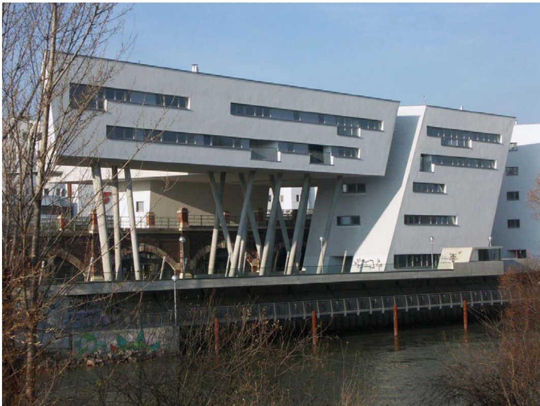
II. 1. Wiedeń — zabudowa mieszkaniowa nad historycznym wiaduktem Spittelau.