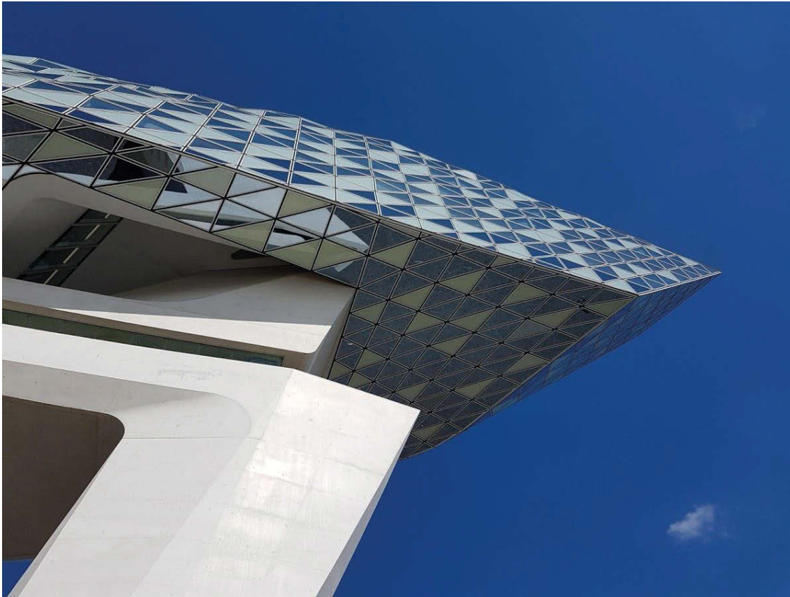
Il. 10, 11, 12. Antwerpia — Nowa Dyrekcja Portu.