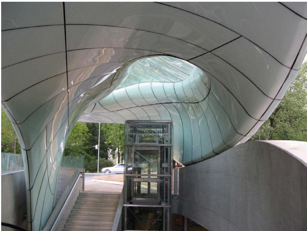
II. 2. Innsbruck — pierwszy przystanek (Congress Station) kolejki szynowej prowadzącej na wzgórze Nordpark.