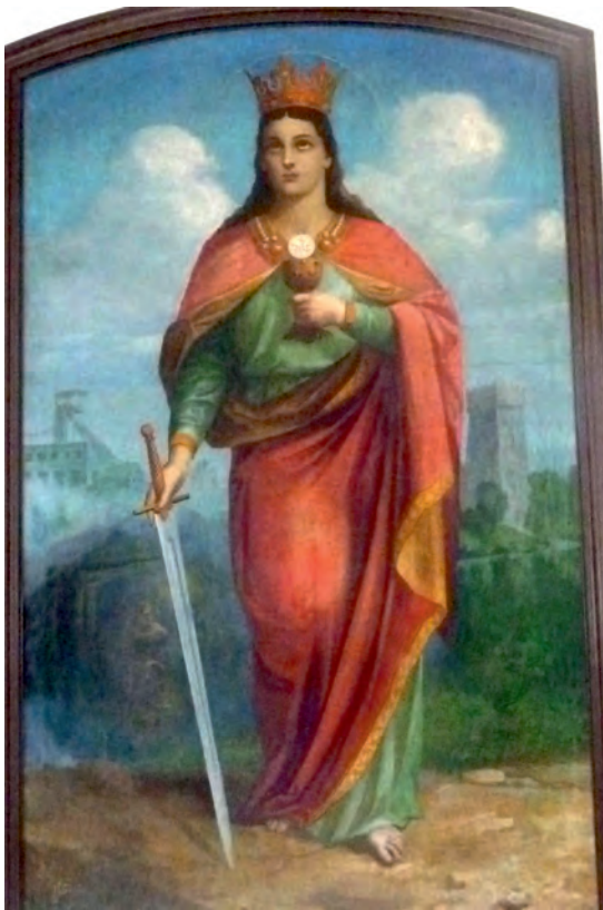
św. Barbara – patronka górników

„Tradycja służy zachowaniu porządku świata. Jeśli ją złamiemy, świat się skończy”