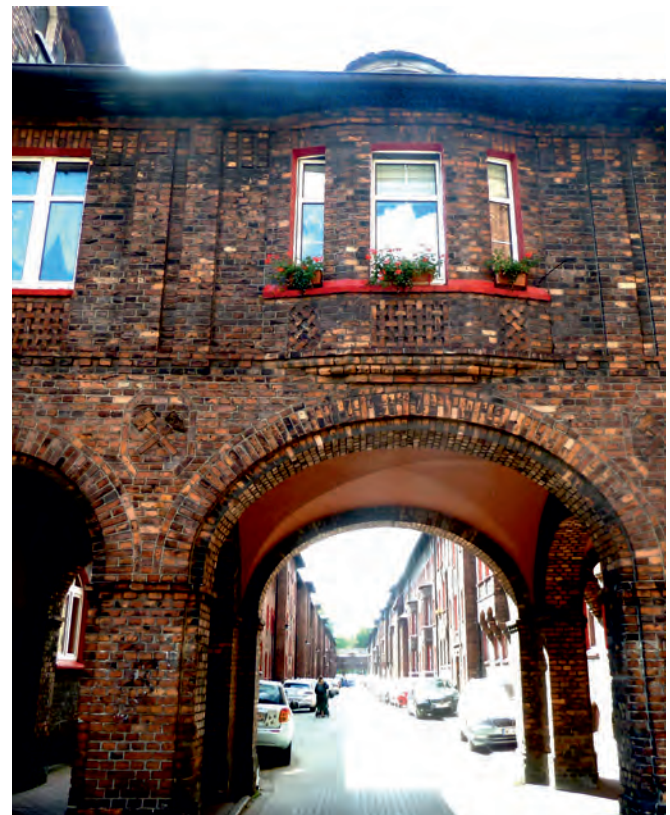
Ramy okienne malowane na czerwono, to symbol śląskich familoków

Trzykondygnacyjne domy z czerwonej cegły zbudowane w formie czworoboków (kwartałów) z wewnętrznymi dziedzińcami mieściły kiedyś chlewiki, komórki, piece do wypieku chleba, a obecnie są to podwórka, ogródki i parkingi dla samochodów. Na obszarze 20 hektarów powstało dziewięć bloków, które zamieszkiwało ok. 5000 robotników z rodzinami.