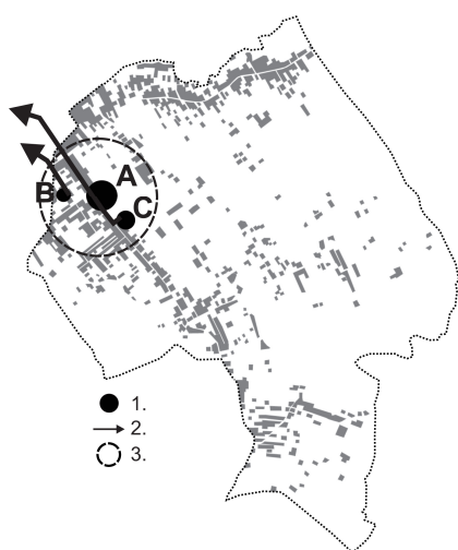
Rys. 3. Przybliżona gęstość i charakter struktury zabudowy osiedla Słocina (stan na 2015 r.) przyłączonego do Rzeszowa w 2006 r., oznaczenia: 1 - lokalizacja zabudowy wielorodzinnej, 2 - kierunek ciężenia obsługi komunikacyjnej, 3 - orientacyjny obszar najbliższego sąsiedztwa i wzmożonej interakcji, A,B,C - oznaczenia pojedynczych obiektów i zespołów zabudowy (opracowanie własne auterek)

osiedla nastąpiło szybkie przemieszanie się zabudowy o różnym charakterze i różnym sposobie użytkowania dzięki czemu można pokusić się o analizę interakcji pomiędzy sąsiadującymi funkcjami i formami.