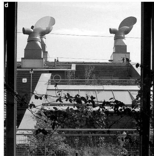
Zespół mieszkaniowy BedZED, Londyn, a – ogniwa fotowoltaiczne, b – miejsce parkingowe z ładowaniem dla samochodu z napędem elektrycznym, c – widoczne dla mieszkańca wskaźniki zużycia energii i wody, d – zieleń w ogrodzie, na tarasie i na dachu Residential complex BedZED, London, a – photovoltaic cells, b – parking place with a charger for a car with electric drive, c – visible indicators of energy and water usage, d – greenery in the garden, on the terrace and on the roof