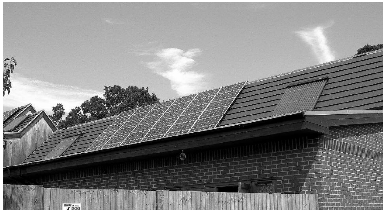
Ogniwa fotowoltaiczne i kolektory słoneczne w zespole mieszkaniowym w Havant Photovoltaic cells and solar collectors in a residential complex, Havant

The full realization of the principles of sustainable design requires politicians’ decisions, professionals’ knowledge and social acceptance. It requires diverse forms of information, education and quality evaluation, broad educational work and co-operation with local societies. At the very beginning of the 21st century, housing environment is characterized by some insoluble old problems, some new problems in an unimaginable global scale, some shocking functional and formal quests and, first of all, a longing for moderation and a return to harmony. It seems that the 21st century will not bring any revolutionary changes in the process of shaping and using European cities. Perhaps the introduction of the method of sustainable design as a common one will make a new element and will shape itself on the ground of the contemporary understanding of the relationships between architecture and nature. No doubt some integrated international actions, making it possible to use foreign methods of planning and designing sustainable housing investments