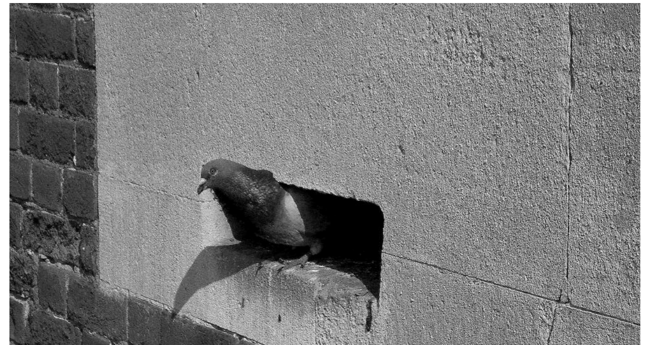
Sprzyjanie bioróżnorodności w Portsmouth Being conducive to biodiversity in Portsmouth