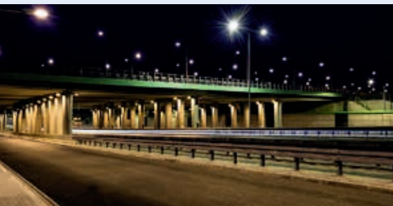
Węzeł drogowy Warszawa Południe (węzeł Lotnisko) w ramach budowy drogi ekspresowej S2 – odcinek Konotopa – Puławska wraz z budową łącznika z MPL Okęcie i ul. Marynarską (S79) w Warszawie

Wśród obiektów nowoczesnych technologii największe uznanie jurorów zdobyło Wielkopolskie Centrum Zaawansowanych Technologii przy ul. Umultowskiej 89c w Poznaniu (etap I i II) – nagrodę I stopnia przyznano generalnemu wykonawcy, firmie Budimex SA (Oddział Budownictwa Ogólnego Północ w Poznaniu).