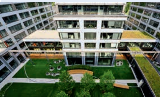
Miasteczko Orange w Warszawie

kacyjno-handlowe na stacji Katowice Osobowa, składające się z dworca kolejowego, podziemnego dworca autobusowego, tunelu drogowego, parkingów podziemnych, galerii handlowej i wielosalowego kina w Katowicach (generalny wykonawca: Strabag Sp. z o.o.), modernizację dostępu drogowego do portu w Szczecinie, węzeł drogowy Warszawa Południe (węzeł Lotnisko) w ramach budowy drogi ekspresowej S2 na odcinku Konotopa – Puławska wraz z budową łącznika z MPL Okęcie i ul. Marynarską (S79) w Warszawie (generalny wykonawca: Porr Polska SA – lider konsorcjum).