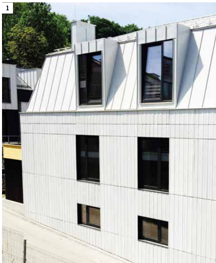
Fot. 1. Elewacja zewnętrzna. Dom jednorodzinny w Krakowie. Realizacja KROE.eu