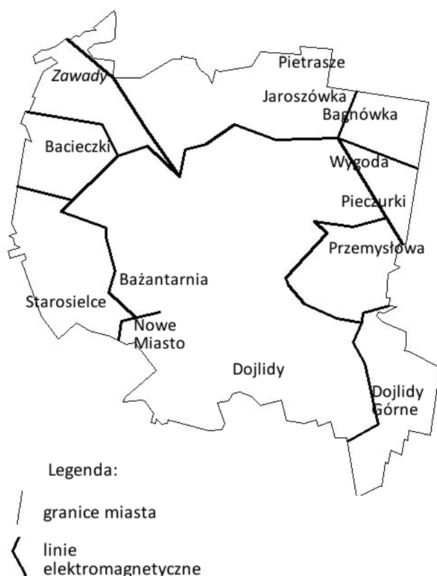
Rysunek 3 Schemat rozmieszczenia linii wysokiego napięcia