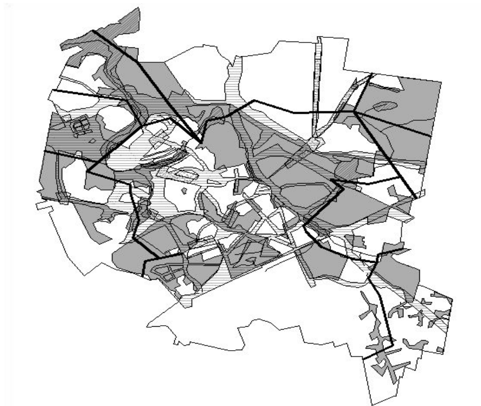
Rysunek 6 Suma powierzchni terenów zalewowych, z hałasem powyżej 55dB i liniami elektroenergetycznymi wysokiego napięcia na tle pokrycia miasta MPZP