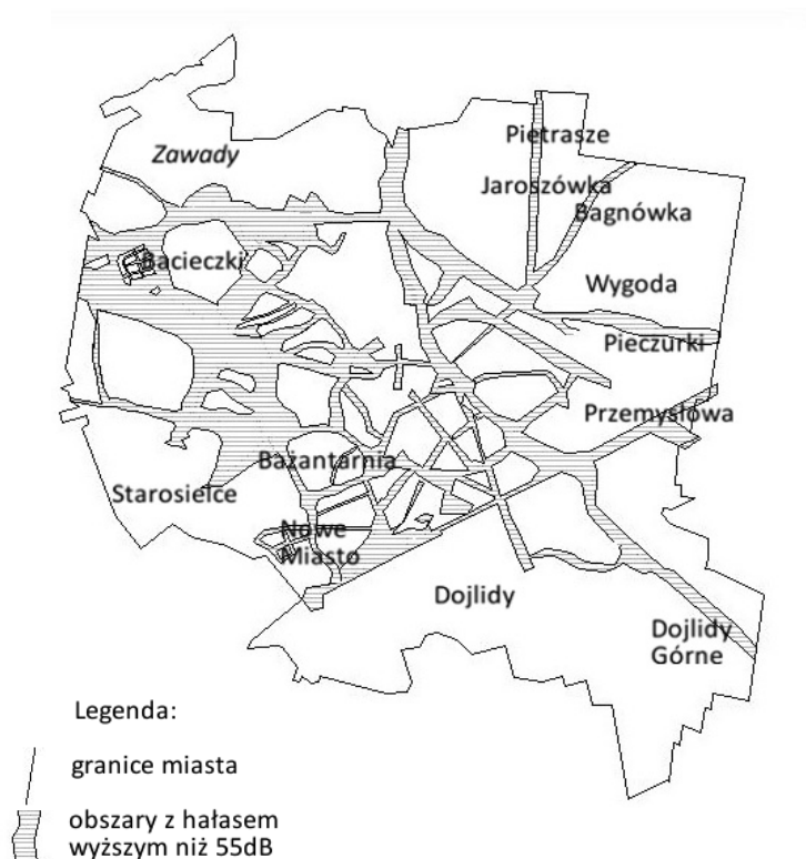
Rysunek 1 Obszary z poziomem hałasu powyżej 55dB w Białymstoku