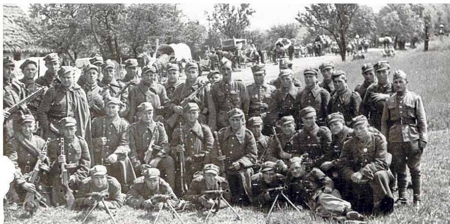
Rysunek 2. Fotografia przedstawiająca żołnierzy batalionu KBW Poznań

Przesiedlenia objęły ok. 140 tys. ludzi zamieszkujących tereny województw lubelskiego, rzeszowskiego oraz krakowskiego, którzy nie zostali wywiezieni w głąb Związku Radzieckiego. Zostali oni osiedleni w większości na obszarze Ziemi Odzyskanych 13 . Przesiedleńcy mieli niewiele czasu i możliwości na zabranie swojego dobytku (wg instrukcji były to około 2 godziny), więc wszystko co zostawili było zabezpieczane przez żołnierzy i przekazywane lokalnym władzom, a w następnej kolejności Komitetom Osiedleńczym, bądź samopomocy chłopskiej. Sprawę pozostawionych nieruchomości regulował specjalnie w tym celu wydany dekret z dnia 27 lipca 1949 r. o przejęciu na własność państwa niepozostających w faktycznym władaniu właścicieli nieruchomości ziemskich, położonych w niektórych powiatach województwa białostockiego, lubelskiego, rzeszowskiego i krakowskiego 14 .