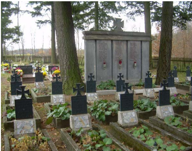
Il. 6. Cmentarz katolicki. Kwaterna żołnierzy poległych w pierwszej wojnie światowej wraz z monumentem.