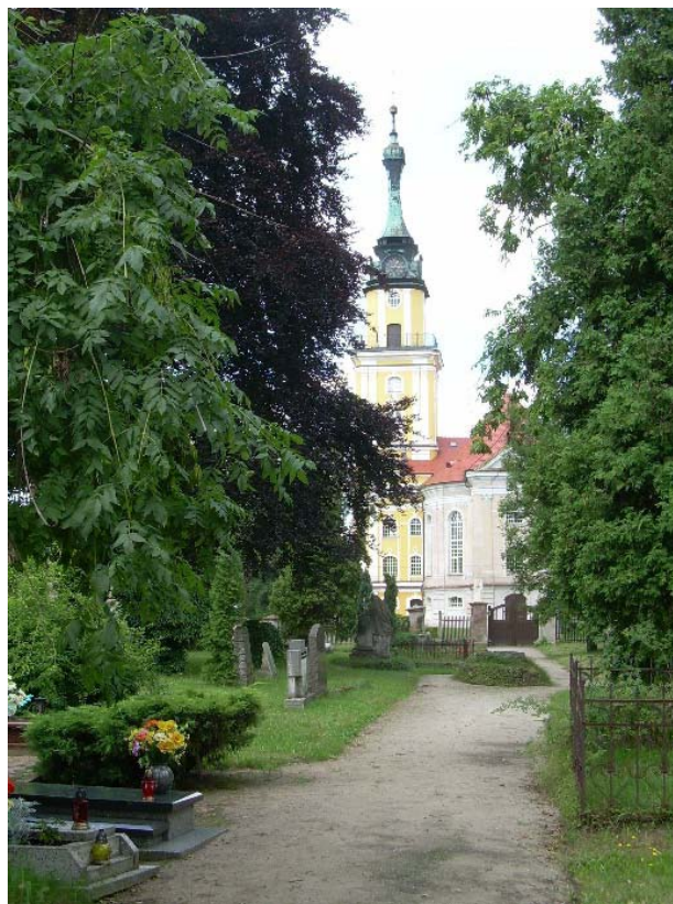
Il. 3. Cmentarz ewangelicki. Główna oś nekropolii z barokowym kościołem Zofii (foto M.E. Adamska, 2010).

Cmentarz ewangelicki założono w 2. poł. XVIII w. 20 sytuując go obok kościoła, na przedłużeniu jego poprzecznej osi, prostopadłe do Kirch Allee (il. 2, 3). Wraz ze wzrostem liczby ewangelików w Pokoju, cmentarz został pod koniec XVIII w. powiększony w kierunku południowo-wschodnim. Obecnie ne-