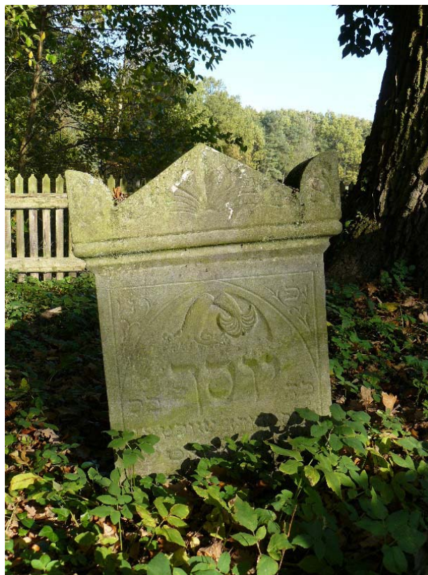
Il. 7. Cmentarz żydowski. Macewa z symbolicznym elementem reliefowym w formie złamanego drzewa (foto M.E. Adamska, 2014).

Cmentarz żydowski w Pokoju został założony ok. 1870 roku 36 . Kirkut został zlokalizowany na północno-wschodnich obrzeżach miejscowości, w pobliżu zrealizowanej wkrótce po założeniu cmentarza, a obecnie nieczynnej linii kolejowej relacji Opole-Namysłów (il. 2). Cmentarz o pow. ok. 0,14 ha, jest jednym z 18 zachowanych cmentarzy żydowskich na Śląsku Opolskim 37 . Niemal do końca lat 60. XX w. cmentarz trwał w prawie nienaruszonym stanie. W 1969 r. podjęto decyzję o likwidacji cmentarza, usunięciu nagrobków i rozebraniu domu przedpogrzebowego. Podobne działania objęły teren całego kraju zgodnie z antysemitką polityką prowadzoną przez ówczesne władze Polski. Plan likwidacji cmentarza został jednak zrealizowany w części, usunięto nagrobki z przedniej części nekropolii, pozostawiono te usytuowane w głębi. W latach 2005-