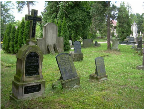
Il. 5. Cmentarz ewangelicki. Rozwiązania kompozycyjne historycznych nagrobków.