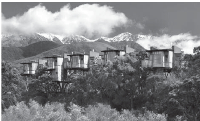
il. 4. Hapuku Lodge Hotel, Kaikoura, Nowa Zelandia; źródło: booked.com.pl il. 5. Supertrees Gardens by the Bay, Singapore; źródło: www.hdimagelib.com

A contemporary, global human being is thinking about his or her desires and higher needs in a uni-