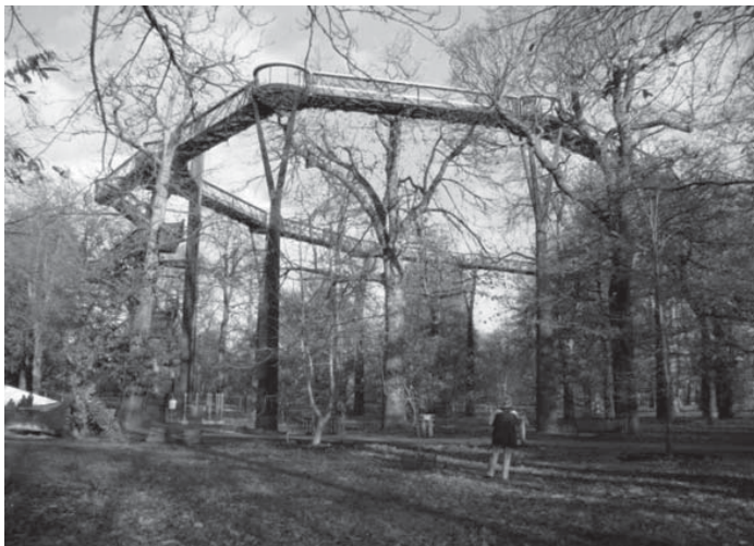
il. 6. Xstrata Tree Walk, Kew Gardens London, fot. W.Chmielewski, 2009. il. 7. Mur Island, Graz, Austria; fot. W.Chmielewski, 2014