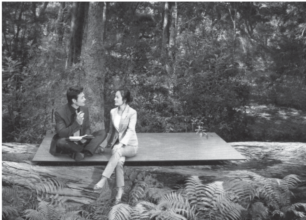
il. 1. Symboliczne miejsce rekreacji-kontemplacji; źródło: Archidea nr. 38/2008

Oglądając rysunki dzieci poświęcone przykładowym wyobrażeniom własnego domu, spotyka się często wizerunek domu niekoniecznie zlokalizowanego na Matce-Ziemi 1 . Taka koncepcja myślowa raczej nie jest motywowana posiadaną wiedzą o domach na drzewach, jako wytworem pewnej marginalnej kultury ludzi dorosłych. Pierwowzorem mogą być jedynie domy ptaków ewentualnie innych zwierząt, na przykład małp. Przykłady literatury dziecięcej wnoszą wprawdzie ten element do języka pojęć filozoficznych, ale nie jest on na tyle powszechny aby można było mówić o wsparciu edukacyjnym w tym zakresie najmłodszego pokolenia. Znane mi ilustracje przedmiotu rozważań świadczą raczej o chęci ucieczki lub marzeń o własnym, innym i bezpiecznym świecie. A więc czegoś pozytywnego dla egzystencji baśniowej.