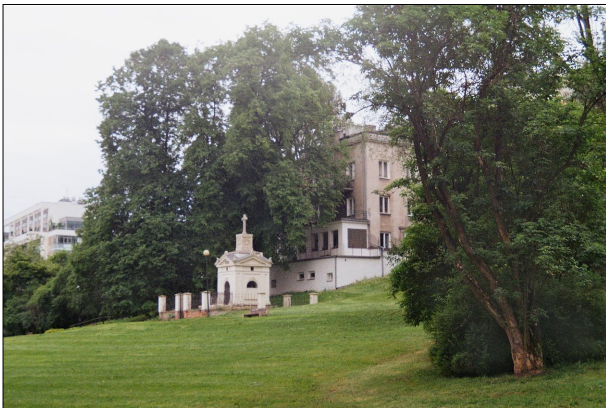
Fot. 2. Dawna i nowa (po lewej) zabudowa skarpy. Photo 2. Old and new (left side) houses on the scarp.

Po 1989 r. krajobraz skarpy i okolic zyskał opinię pożądanego miejsca zamieszkania. Rozległy widok na dolinę Wisły, obfitość terenów zieleni, dobra infrastruktura, a nade wszystko sąsiedztwo przedwojennej, „prawdziwej Warszawy” to atuty, które zdecydowały o powstaniu wielu nowych budynków mieszkalnych, głównie apartamentowców (fot. 2). Zbudowano je m.in. w miejscu dawnego bazaru przy ul. Ludowej tuż pod skarpą, w parku Morskie Oko przy Pałacu Szustra tuż nad skarpą, przy ul. Słonecznej na skarpie i nad nią, przy ul. Nabelaka i Belwederskiej pod skarpą. Budynki te, z reguły niezbyt wysokie i dobrze wkomponowane w otoczenie, są zamieszkałe przez zamożniejszych mieszkańców, w tym cudzoziemców.