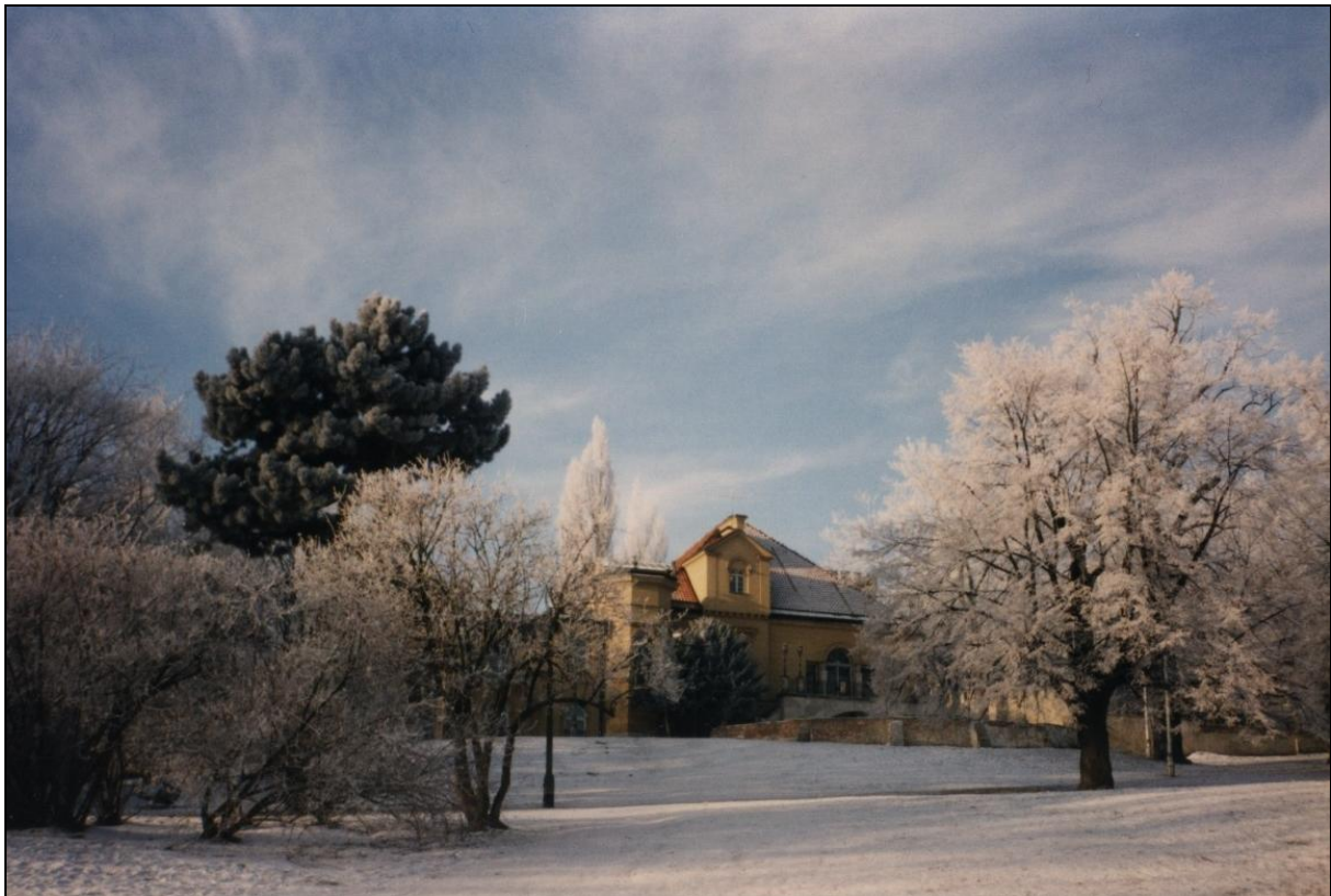
Fot. 1. Pałac Szustra w parku Morskie Oko zimą. Photo 1. Szuster's Palais in the parc Morskie Oko in winter.

Oko 2). Od strony ulicy Puławskiej otaczający go park zamykają Domek Flamandzki (Mauretański) i Gołębnik (1776-79). Inne pawilony ówczesnego parku nie zachowały się do naszych czasów. Nie zachowała się także utworzona wówczas sieć wodna podskarpia i okolic. Wykorzystując źródła u podnóża skarpy, stawy i naturalne podmokłości, ogrodnik króla Stanisława Augusta, Jan Christian Szuch, zaprojektował sieć kanałów, łączących dwie wspaniałe rezydencje – królewską w Łazienkach i dolną część pięknego „ogrodu w Mokotowie” marszałkowej Lubomirskiej. Krajobraz ówczesnych Sielc i Mokotowa uwieczniono na licznych obrazach (m.in. Canaletto i Zygmunt Vogel) i w wierszach (Świątek, 2006).