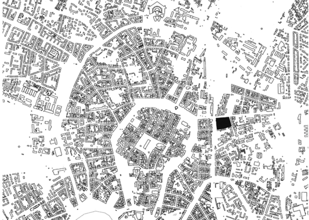
il. 1. Zespół zabudowy mieszkaniowo-usługowej na terenie dawnego Browaru Goetzów przy ul. Lubicz w Krakowie, schemat zagospodarowania terenu. Ciemnym tłem wyróżniono obiekty zabytkowe. Rys. autor / Complex of residential and service buildings in the former Goetz Brewery - land development scheme. The historical buildings are distinguished by dark background pattern. Drawn by the author