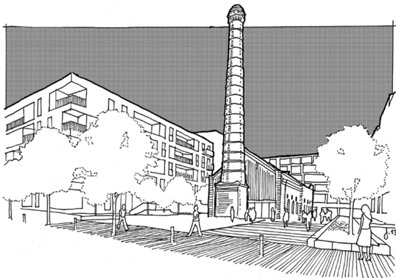
il. 3. Obszar „Browar Lubicz” na tle planu Krakowa. Rys. autor / The area of "The Lubicz Brewery" marked on the plan of Cracow. Drawn by the author