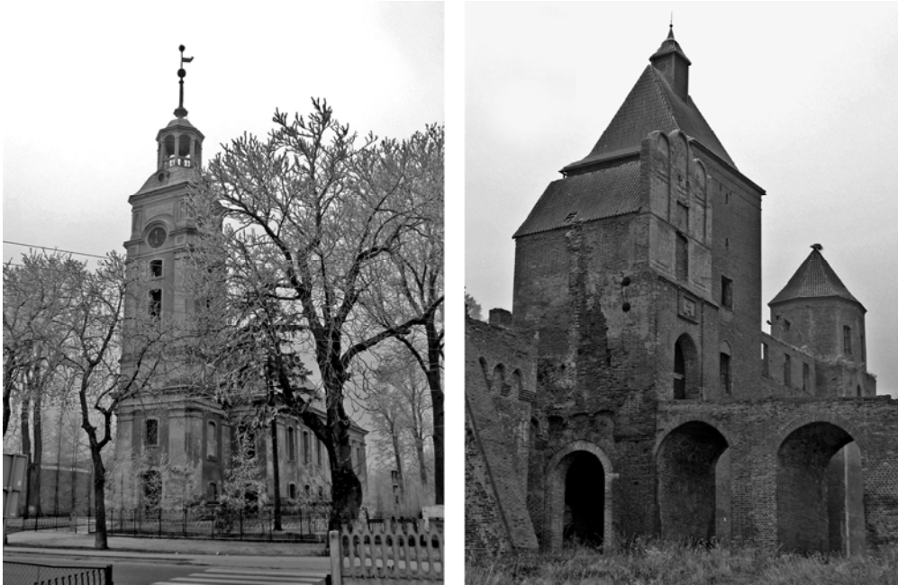
Fot. 1, 2. XVIII wieczny kościół w Kamieńcu i ruiny zamku w Szymbarku.