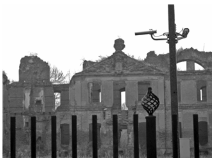
Fot. 10. Ruiny pałacu w Kamieńcu..

Photo 10. The ruins of the palace in Szymbark.