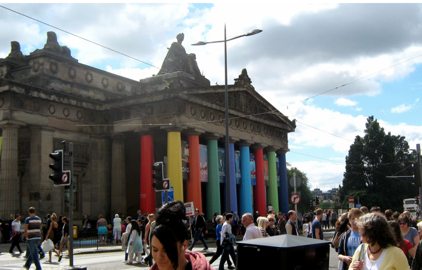
Ryc. 6. Urozmaicenie obiektów zabytkowych na czas festiwalu w Edynburgu; fot. Monika Mularz Fig.6. Diversifying the historic buildings on the duration of the festival in Edinburgh; photo Monika Mularz

Tymczasowe obiekty architektoniczne w przestrzeni miejskiej stanowią wartość chwilową, która ma spełnić ściśle określone zadania. Obiekty te kierowane są zazwyczaj w konkretne przestrzenie i odpowiadają potrzebom użytkowników. Dzięki zaangażowaniu mniejszych nakładów finansowych działania związane z tymczasowością mogą być stosowane częściej