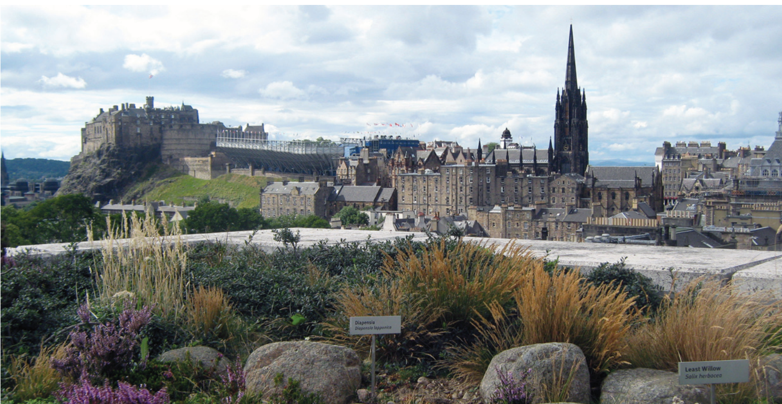
Ryc. 3. Widok na Stare Miasto z Zamkiem i dobudowanymi na czas festiwalu trybunami Fig. 3. View of the Old Town with the castle and the platform built on the duration of the festival