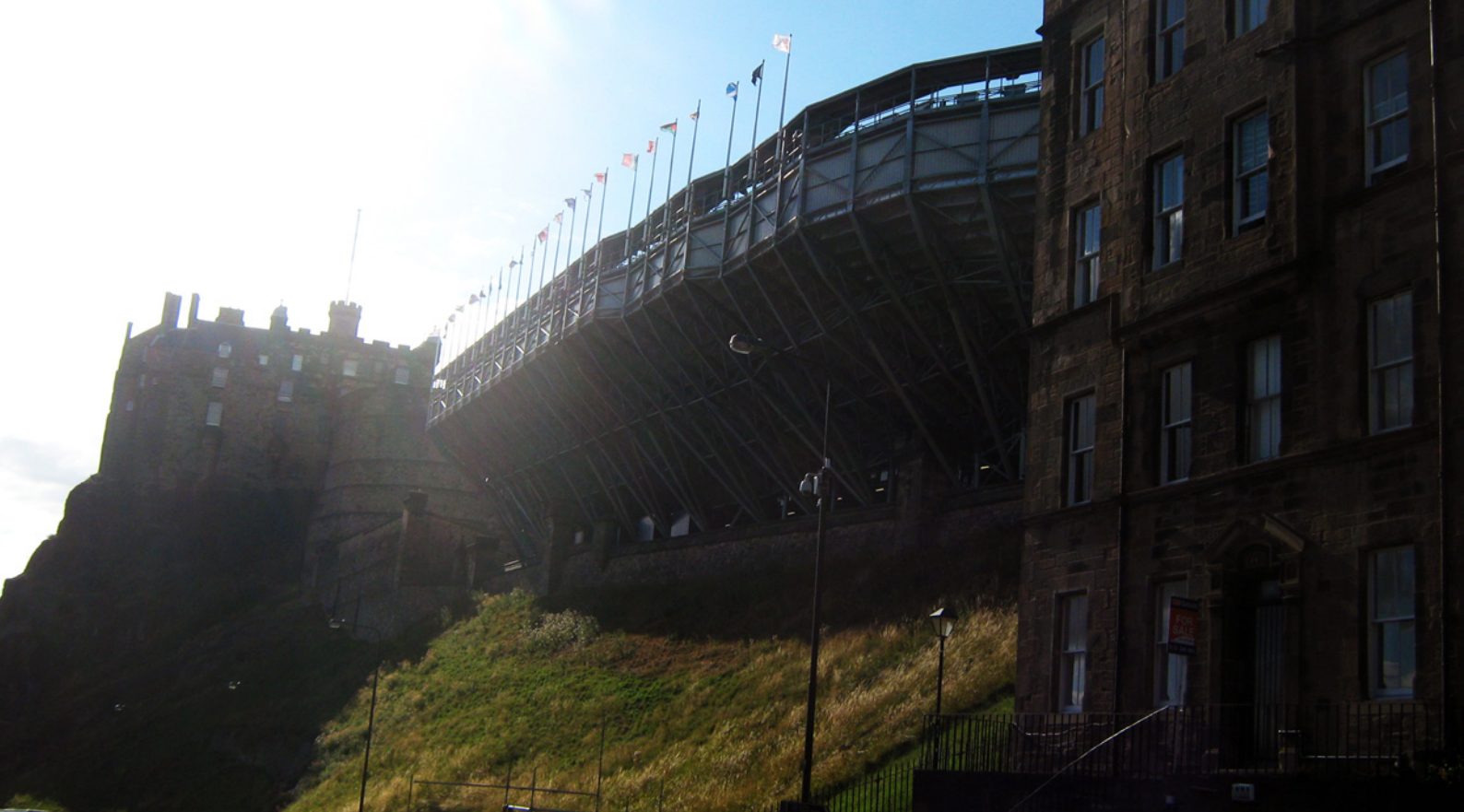
Ryc. 4. Konstrukcja trybun dobudowywanych do Starego Zamku na czas festiwalu; fot. Monika Mularz Fig. 4. The construction of platform built on the duration of the festival at the Old Castle; photo Monika Mularz