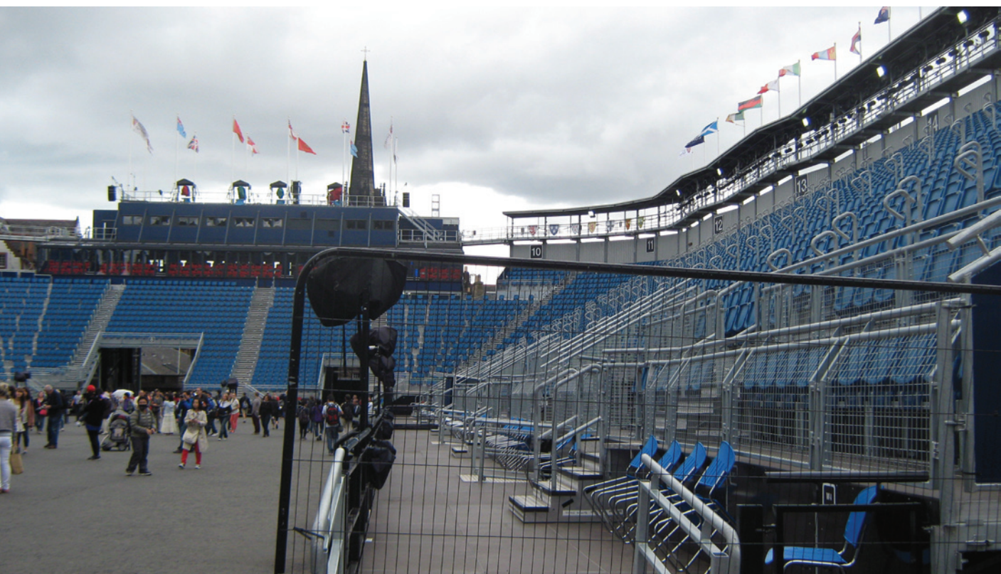
Ryc. 5. Trybuny i scena przy Starym Zamku; fot. Monika Mularz Fig. 5. Grandstands and the scene at the Old Castle; photo Monika Mularz