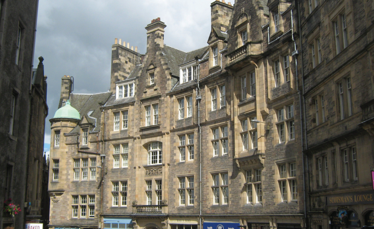
Ryc. 1. Zabudowa średniowieczna Starego Miasta w Edynburgu; fot. Monika Mularz Fig. 1. Medieval buildings in Edinburgh's Old Town; photo Monika Mularz