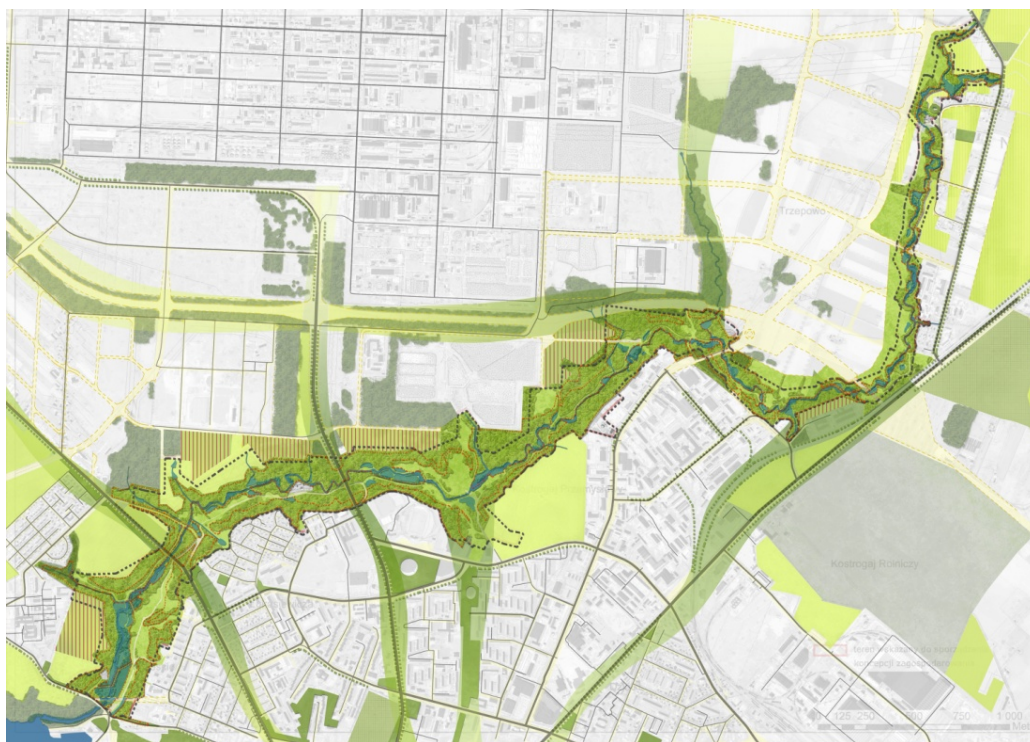
Fig. 4. Scheme of green infrastructure of river Brzeznica ravine park.

Systems of urban green improve rainwater purification and retention, they can be also a component of drainage system, however, sustainable stormwater arrangement solutions should be implemented into the design process from its earliest stages. Januchta-Szostak [13] remarks, that very valuable initiative in the context of water management in cities are buffer river parks, which aim is ecosystem protection of river valleys, retention and initial purifying of storm water runoff, and simultaneously assigns flood prone areas recreational function.