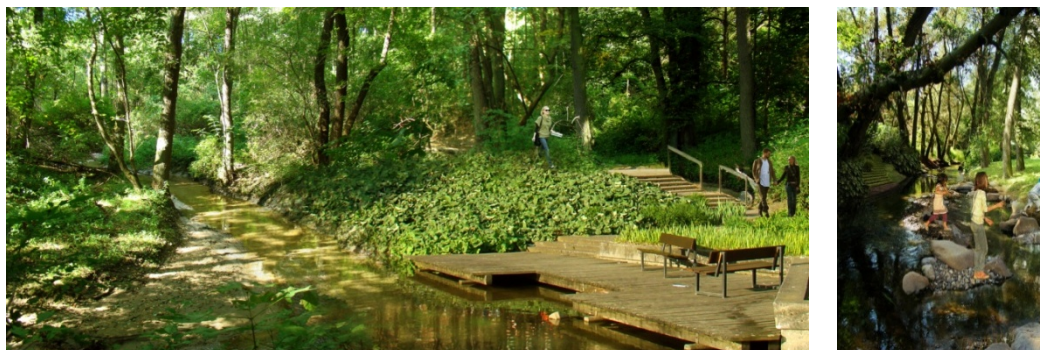
Fig. 5-6 Visuals displaying opportunities of integration of river's natural environment and citizens of Plock.

Rys. 5-6 Wizualizacje przedstawiające możliwości integracji środowiska naturalnego, rzeki i mieszkańców Płocka.