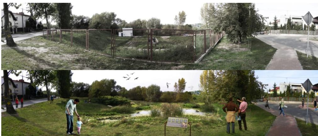
Fig. 8-9 Visuals showing current rainwater storage system and designed rain water storage located near Wyspiańskiego and Mehoffera streets in Płock. Źródło: Joanna Jaskułowska

Rys. 8-9 Wizualizacje przedstawiające stan istniejący i projektowany, pokazujące przekształcenia podziemnego zbiornika na wody opadowe usytuowanego u zbiegu ulic Wyspiańskiego i Mehoffera w Płocku w otwarty. Źródło: Joanna Jaskułowska