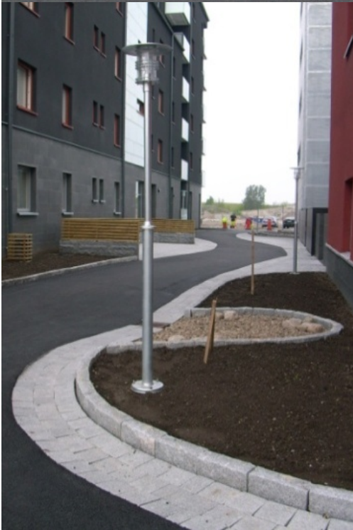
Fig. 1. 2. Sustainable urban drainage system composed into local street and playground in Malmo

Rys.1 2. System drenażu miejskiego wkomponowany w osiedlową ulicę i plac zabaw w Malmo.