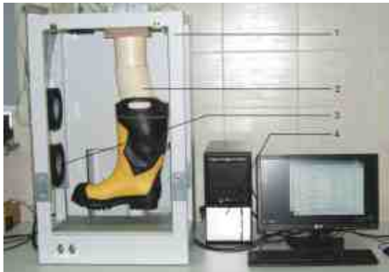
Rys. 4. Stanowisko pomiarowe; 1 – komora klimatyczna; 2 – symulator kończyny dolnej o wysokości do kolana; 3 – blok sterowania przepływem powietrza; 4 – komputer wraz z oprogramowaniem sterującym modelem

Fig. 4. Testing equipment; 1- climatic chamber; 2 – knee high leg simulator; 3 – air flow controlling unit; 4 – computer with software controlling leg simulator