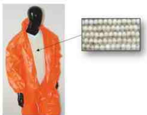
Rys. 2. Kamizelka o właściwościach termoregulacyjnych zastosowana pod szczelną ochroną Fig. 2. Vest with thermo-regulating properties under clothing protecting against chemicals

Z uwagi na znaczące obciążenie cieplne związane z pracą w barierowej odzieży ochronnej w środowisku gorącym, osoby pracujące w takich warunkach wymagają znacząco krótszych okresów pracy, częstszych i dłuższych okresów odpoczynku [7-9]. Dlatego ważne jest, aby w tym zakresie wykorzystać nowoczesne technologie funkcjonalizacji odzieży ochronnej za pomocą materiałów tzw. inteligentnych, które pod wpływem danego bodźca są zdolne do zmiany swoich właściwości w określony sposób [10]. Najbardziej znaną technologią, która znalazła zastosowanie w konstrukcji inteligentnej odzieży ochronnej są materiały przemiany fazowej (z ang. Phase Change Materials – PCM). Zostały one wykorzystane do opracowania kamizelki, która odbiera nadmiar ciepła generowanego przez ciało człowieka i ogranicza dyskomfort związany z pracą w szczelnej odzieży ochronnej. Kamizelka wykonana została z dwuwarstwowej dzianiny o budowie kanałowej, do której wprowadzono makrokapsułki z materiałami przemiany fazowej (Rys. 2.). Istotą opracowanej kamizelki jest również fakt, iż została ona wykonana z dwuwarstwowej dzianiny, która poprzez odpowiedni układ surowców, w tym udział specjalistycznych, wysokosorpcyjnych włókien celulozowych z makrokapsułkami PCM, zapewnia także regulację wilgotności względnej mikroklimatu pod szczelną odzieżą ochronną [7, 11 - 12].