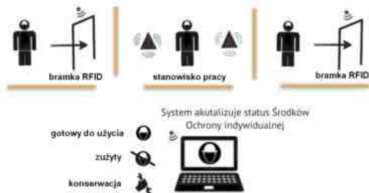
Rys. 3. Schemat zasady działania systemu automatycznej identyfikacji i monitorowania czasu użytkowania środków ochrony indywidualnej

Uzasadnione jest poszukiwanie rozwiązań umożliwiających monitorowanie czasu użytkowania środków ochrony indywidualnej z wykorzystaniem technologii informatycznych. Jedną z propozycji jest system automatycznej identyfikacji i monitorowania czasu użytkowania środków ochrony indywidualnej (przechowywania, stosowania w warunkach środowiska pracy, konserwacji) przedstawiony na Rys. 3. Głównym założeniem proponowanego rozwiązania jest wykorzystanie technologii RFID (ang. RFID - Radio Frequency Identification ), czyli oznakowanie środków ochrony indywidualnej znacznikami elektronicznymi (tagami). Wbudowana w znacznik antena przekazuje dane zapisane w znaczniku do czytnika, a następnie dane te trafiają do bazy danych zapisanej na serwerze. Aplikacja komputerowa, zainstalowana na serwerze, przetwarza te dane, a następnie są one wizualizowane na ekranie komputera (terminal użytkownika).