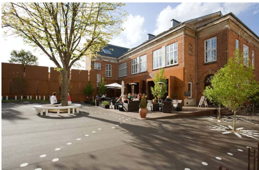
Ryc. 2. Przestrzeń publiczna stworzona wokół kulturalnego centrum Nicolai, Kolding, Dania.

granice placu i wcinia się w sąsiadujące z nim ulice, co ułatwia zbliżającym się do placu orientację, w pewien sposób zapowiada, że już za moment znajdą się w strefie reprezentacyjnej i wyjątkowej.