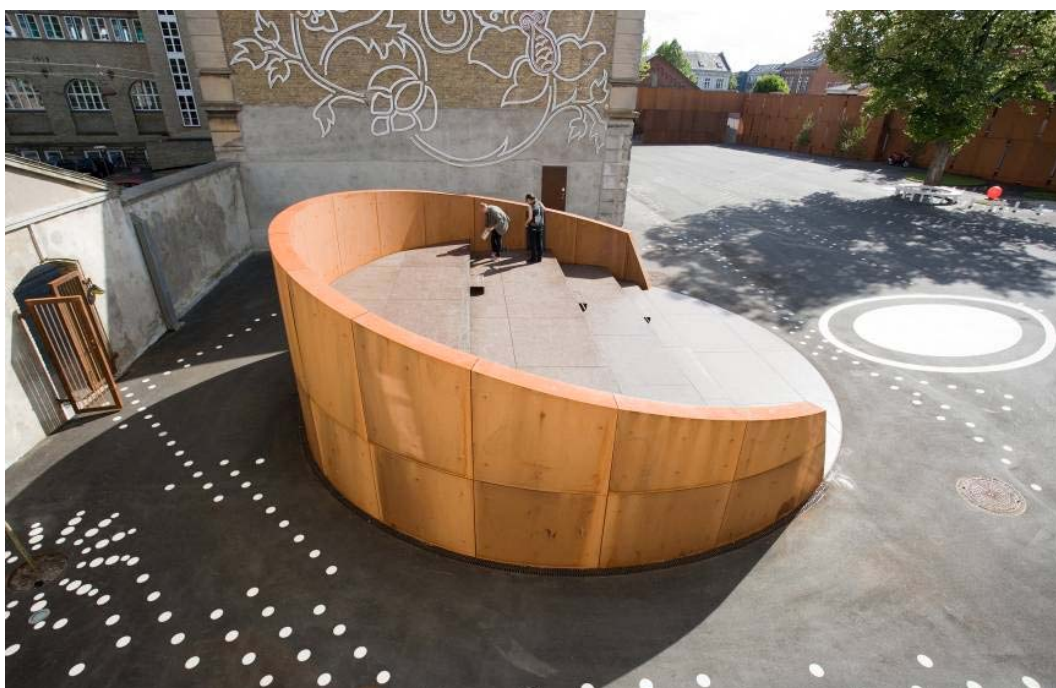
Ryc. 3. Amfiteatr w przestrzeni publicznej wokół kulturalnego centrum Nicolai, Kolding, Dania.

Małomiejskie „transformacje” dążą do uczynienia przestrzeni miejskiej atrakcyjną dla współczesnych, coraz bardziej wymagających użytkowników. Jednocześnie przy ich pomocy scala się tkankę miejską, wypełnia „pustki”, łączy fragmenty miasta.