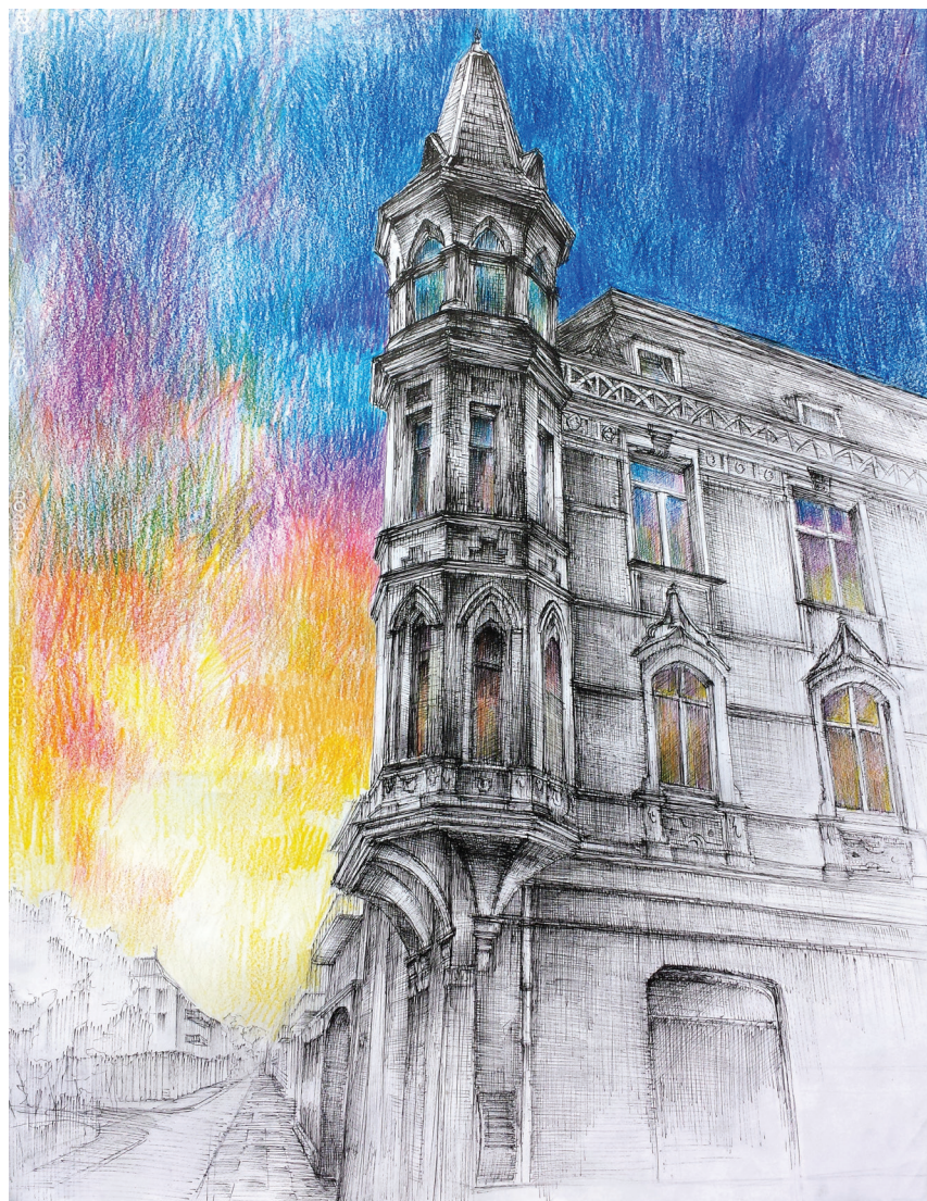
Fot. 3. Wykuszk kamienicy przy ul. Grudziądzkiej, rys. stud. A. Ręczkowska 2017 (fot. aut.)

Studenci zajmowali się pracami w różnych technikach (techniki rysunkowe – ołówek, kredki, tusz, flamastry oraz techniki malar-