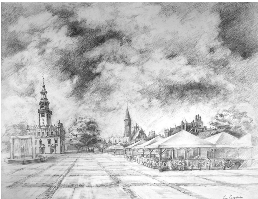
Fot. 1. Widok na rynek w Chełmnie z ratuszem, rys. stud. V. Kyrylenko 2018

Chełmno, siedziba powiatu chełmińskiego, jest położone nad Wisłą. Jest najstarszym miastem Ziemi Chełmińskiej. Zachowała się tu średniowieczna struktura urbanistyczna oraz liczne obiekty architektury z tego okresu, wpisane na Listę Pomników Historii Prezydenta RP. Ze względu na dziedzictwo architektury średniowiecznej miasto znajduje się na Europejskim Szlaku Gotyku Ceglanego. Szczególne walory turystyczne potwierdzają przyznane miastu certyfikaty: Najlepszy Produkt Turystyczny Polski, Najlepszy Produkt Turystyczny Województwa Kujawsko-Pomorskiego i szóste miejsce w rankingu National Geographic 7 cudów Polski. Oprócz walorów związanych z architekturą Chełmno wyróżnia się szczególnym pięknem natury, obejmują je granice Zespołu Parków Krajobrazowych Chełmińskiego i Nadwiślańskiego. W obszarze miasta znajduje się część rezerwatu przyrody Łęgi na Ostrowiu Panieńskim oraz osiem pomników przyrody [12, s. 12–13].