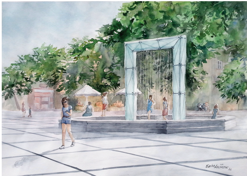
Fot. 4. Fontanna na rynku w Chełmnie, rys. stud. E. Szczepańska (Langrzyk) 2016 (fot. aut.)

W czasie warsztatów studenci oraz mieszkańcy miasta zostali wspólnie zaangażowani w uczestnictwo w zajęciach fotograficznych, rysunkowych, modelarsko-makieciarskich, malarskich czy sitodruku. Podczas tego wydarzenia nastąpiło spotkanie uczestników warsztatów i dotychczasowych odbiorców ich prac. Mieszkańcy spotykali się z twórczością artystyczną studentów podczas wystaw, widzieli je również jako obiekty sztuki ozdabiające przestrzeń publiczną. Oryginały oraz reprodukcje rysunków plenerowych są eksponowane w budynkach użyteczności publicznej i obiektach usługowych na terenie Chełmna, ozdabiają mate-