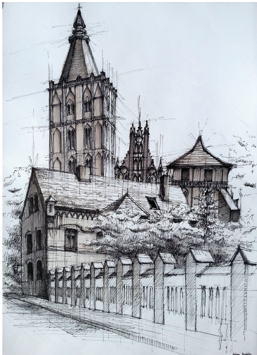
Fot. 2. Widok na kościół farny z ul. Szkolnej, rys. stud. J. Madejska 2016

tu Technologiczno-Humanistycznego w Radomiu, Zachodniopomorskiego Uniwersytetu Technologicznego w Szczecinie, Akademii Sztuk Pięknych w Warszawie, Wyższej Szkoły Gospodarki w Bydgoszczy oraz Uniwersyte-