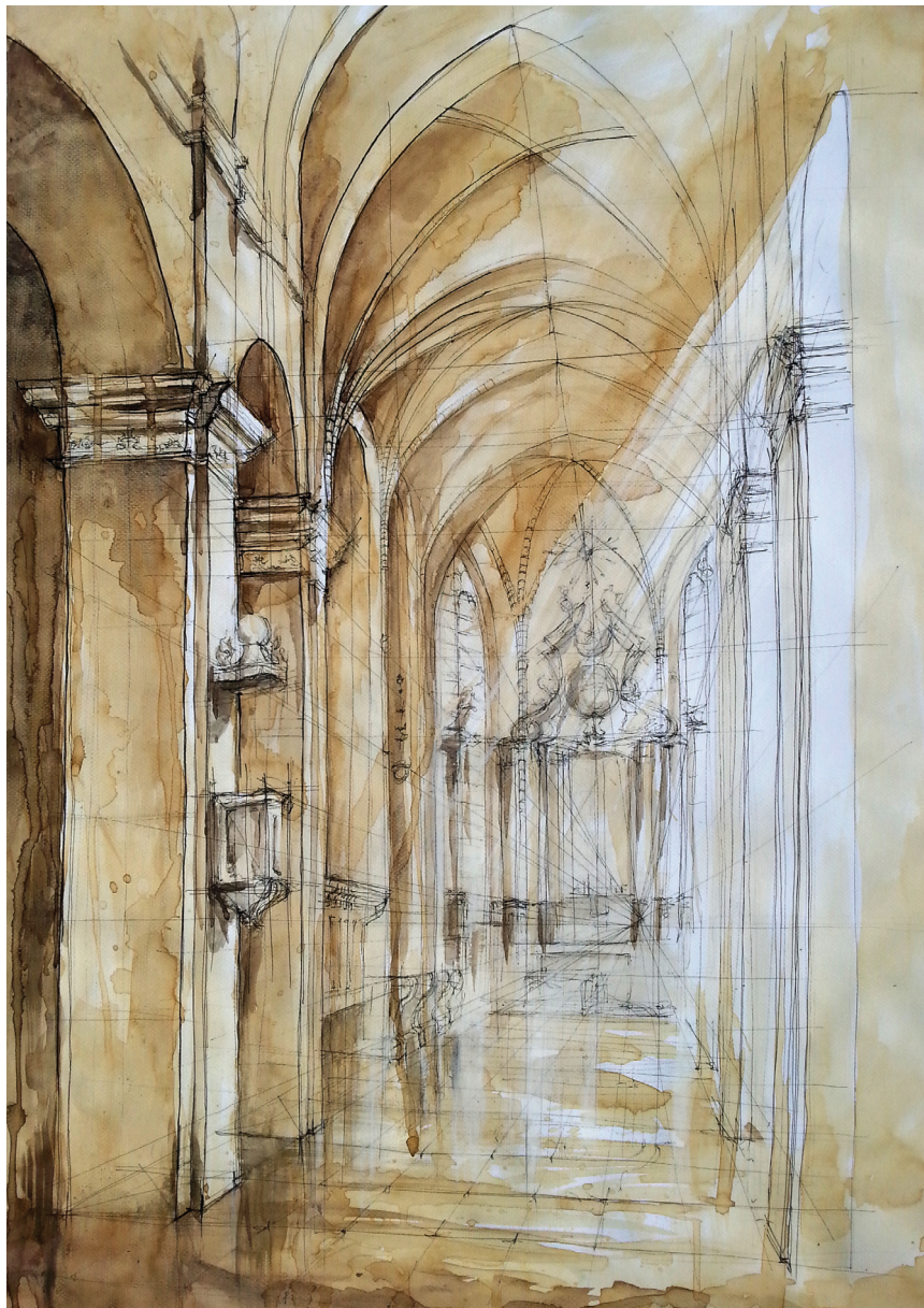
Fot. 5. Wnętrze kościoła pw. św. Piotra i Pawła, rys. stud. S. Mędrala 2016