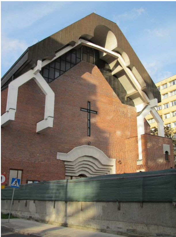
II.7. Kościół Matki Bożej Anielskiej, Mokotów, Warszawa, fot. K. Pluta 2017.

III.7. Church of Matki Bożej Anielskiej, Mokotów district, Warsaw, photo by K. Pluta 2017.