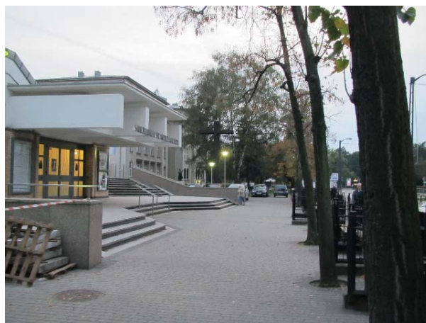
Il.11. Kościół św. Andrzeja Boboli -Sanktuarium (oo. Jezuitów), Warszawa, fot. K. Pluta 2017.

Podsumowując, krajobraz w najbliższym otoczeniu bryły świątyni oraz dominacja jej formy w krajobrazie miasta równoważy niedoskonałości krajobrazu w dalszym jej otoczeniu. (Il.10,Il.11)