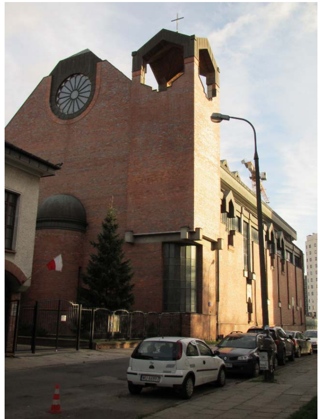
II.8. Kościół Matki Bożej Anielskiej, Mokotów, Warszawa.

III.8. Church of Matki Bożej Anielskiej, Mokotów district, Warsaw.