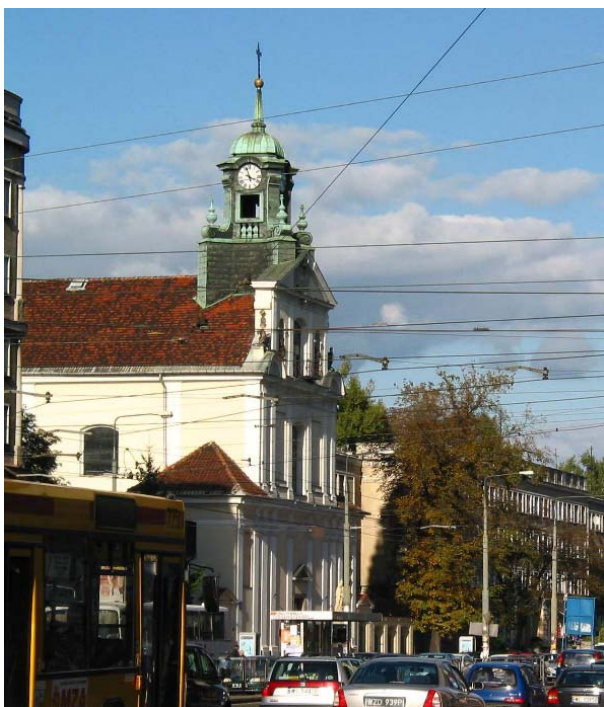
Il. 6. Kościół Narodzenia NMP, Leszno, Warszawa, fot. K. Pluta 2005.

Zabytkowa budowla sakralna została ocalona w dniu 1 grudnia 1962 roku w wyniku przesunięcia na odległość 21 m w głąb posesji z terenu poszerzonej trasy komunikacyjnej.