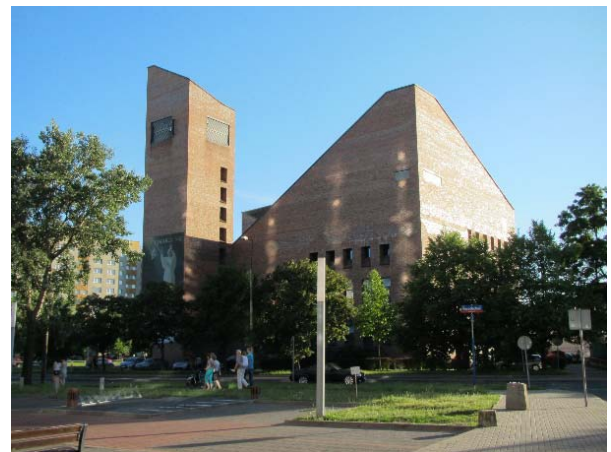
II.9. Kościół Najświętszej Maryi Panny Matki Kościoła, Warszawa, fot. K. Pluta 2016.

III.8. Church of Matki Bożej Anielskiej, Mokotów district, Warsaw, photo by K. Pluta 2017.