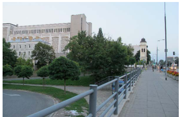
II.5. Kościół św. Michała Archanioła, Mokotów, Warszawa, fot. K. Pluta 2017.