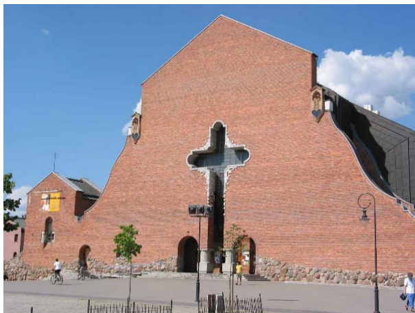
Il.12. Kościół Wniebowstąpienia Pańskiego, Warszawa, fot. K. Pluta 2006.

Bryła kościoła wraz z dzwonnica widoczna jest z Alei KEN z dalszej perspektywy, zapowiadając dzięki swojej oryginalnej formie unikatową rzeźbę w krajobrazie miasta. Zbliżając się w stronę kościoła między nową zabudową tworzącą wyraźne pierzeje ulicy, zaczynamy dostrzegać więcej szczegółów, zwłaszcza charakterystyczne detale dzwonnicy. Skręcając w ulicę Dzwonnica po przejściu ok. 100 metrów znajduje się rozległy plac wejściowy przed kościołem, którego wejściowa fasada stanowi jeden z najbardziej charakterystycznych i symbolicznych motywów całej dzielnicy. (Il.12)