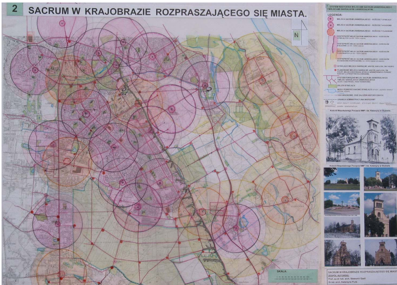
II.14. Sacrum w krajobrazie rozpraszającego się miasta, Warszawa, proj. S. Gzell, K. Pluta 2006.