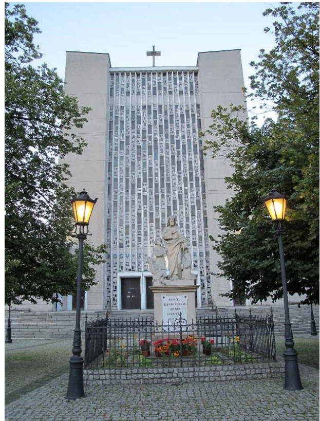
II.4. Kościół św. Michała Archanioła, Mokotów, Warszawa, fot. K. Pluta 2017.

Miejsce to powinno być przeznaczone na zabudowę nawiązującą do istniejącego charakteru ulicy i stanowiącą neutralne tło dla budowli sakralnej. Obszar Skarpy w okolicach ul. Dolnej wymaga także licznych przekształceń przestrzennych: odsłonięcia widoku na kościół i plebanię z niższego tarasu (obecnie gęste zadrzewienia), zasłonięcia szczytu budynku mieszkalnego w złym stanie technicznym, przeprowadzenia ciągu pieszego w rejonie skarpy (w tym: odtworzenia płynnego zejścia po skarpie w rejonie stawu, kompozycji zieleni na koronie skarpy i na podskarpiu). Dodać należy, że obszar ten był przedmiotem wielu analiz i studiów. Prof. Andrzej Kiciński proponował przebicie ulicy Dolnej w tunelu pod ulicą Puławską, co usprawniłoby znacznie ruch oraz poprawiłoby krajobraz tego obszaru. Jednakże jest to przedsięwzięcie wymagające wielu przekształceń struktury przestrzennej dzielnicy i obecnie pojawiają się pomysły jedynie włączenia do ulicy Dolnej nowej ulicy biegnącej na dolnym tarasie obok istniejącego stawu w kierunku południowo-wschodnim bez zastosowania tunelu. Niestety takie rozwiązanie może pogłębić negatywne przemiany krajobrazu i zmniejszyć rolę kościoła w krajobrazie Skarpy Warszawskiej. (II.4,II.5)