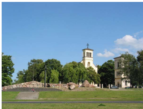
II.2. Kościół Niepokalanego Poczęcia NMP i św. Katarzyny w Służewie, Warszawa, fot. K. Pluta 2004.

lu miejsc. Jednakże współczesne otoczenie świątyni stanowi duży kontrast z historyczną budowlą - są to zarówno wielorodzinne prefabrykowane osiedla mieszkaniowe, jak i nowe zespoły mieszkaniowe.