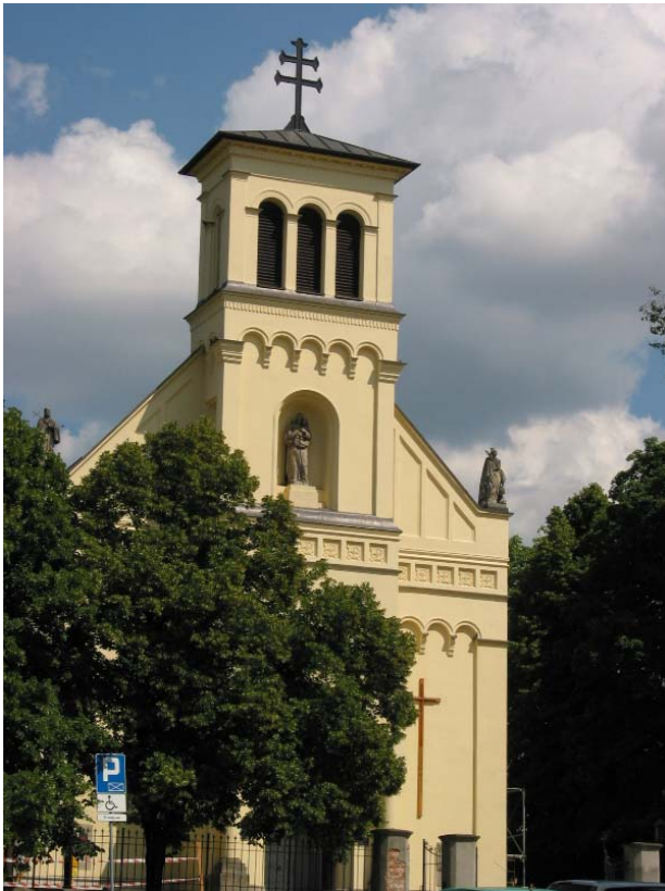
II.3. Kościół Niepokalanego Poczęcia NMP i św. Katarzyny w Służewie, Warszawa, fot. K. Pluta 2005.