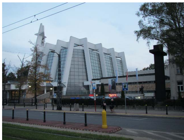
Il.10. Kościół św. Andrzeja Boboli -Sanktuarium (oo. Jezuitów), Warszawa, fot. K. Pluta 2017.

Zjawisko to spowodowane jest brakiem kompozycji drugiej pierzei ulicy Rakowieckiej, którą tworzą punktowe budowle o różnej wysokości, formie i funkcji, przypadkowe nasadzenia zieleni. Przed wejściem na dziedziniec świątyni znajduje się par-