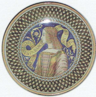
Fot. 2. Talerz majolikowy z wizerunkiem pięknej kobiety w stroju historycznym (Kadyny, przed 1909 r., Oswald Bachmann, kolekcja prywatna)