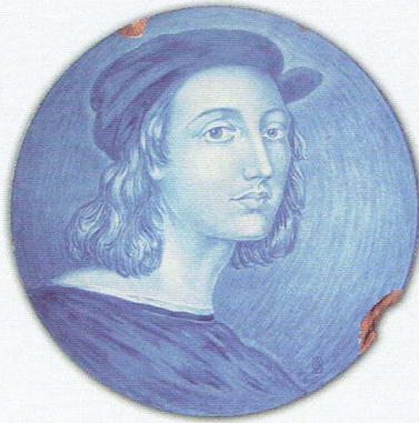
Fot. 3. Talerz z portretem Rafaela (Kadyny, przed 1909 r., Oswald Bachmann, kolekcja prywatna)