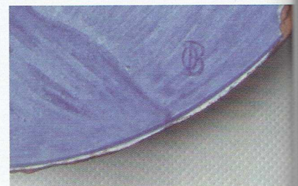
Fot. 5. Sygnatura malarska Oswalda Bachmanna (Kadyny, przed 1909 r.)

Zarówno Heydel, jak Bachmann czy Dietrich sygnowali większość swoich prac malarskich – zwłaszcza tych lepszych pod względem artystycznym (fot. 5).