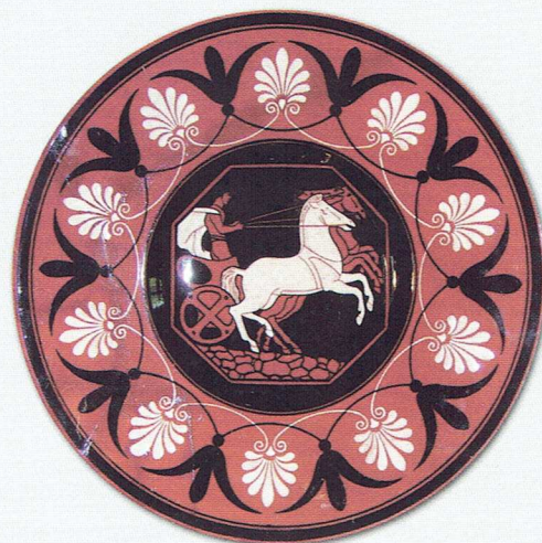
Fot. 6. Talerz z rydwanem w manierze etruskiej (Kadyny, 1925 r., malarz nieznan)

Opracowanie ilustracji do druku Lech Okoński na zlecenie Muzeum Zamkowego w Malborku