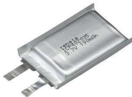
Rys. 2. Ogniwo litowo-polimerowe [1]

Ogniwa te posiadają hermetyczną obudowę o wysokiej elastyczności. Nie wydzielają gazów podczas normalnej pracy. Zaciski ogniwa wykonane są z dwóch metalowych pasków: aluminium i niklu, które dodatkowo pełnią funkcję bezpiecznika. Taki układ zacisków umożliwia fizyczną ochronę ogniwa przed zewnętrznym zwarcie. Producent podaje maksymalne napięcie rozładowania 3 V, poniżej tej wartości należy odłączyć i ładować ogniwo. Nie należy dopuścić do głębszego rozładowania, ponieważ niekorzystnie wpływa to na żywotność ogniwa. Podobnie przy maksymalnym napięciu ładowania producent podaje 4,15 V, dalsze przeładowanie ogniwa może spowodować jego uszkodzenie i niekorzystnie wpłynąć na jego żywotność.