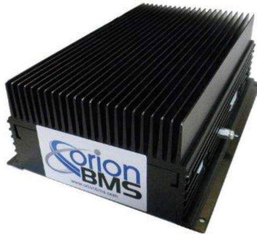
Rys. 6. BMS 2.0 ORION [7]

System BMS 2.0 ORION jest systemem komercyjnym, powszechnie stosowanym w przemyśle motoryzacyjnym z pasywnym układem wyrównywania pojemności baterii.