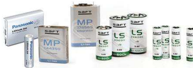
Rys. 4. Ogniwa litowo-jonowe [1]

Ogniwa litowo-jonowe (rys. 4) są jednym z najnowszych rozwiązań wśród ogniwo wielokrotnego ładowania (wtórnych).