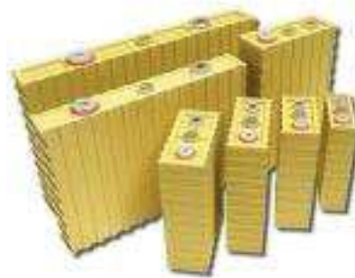
Rys. 5. Ogniwa litowo-żelazowo-fosforanowe [1]

Ogniwa litowo-żelazowo-fosforanowe (rys. 5) są obecnie coraz częściej stosowane zarówno w przemyśle motoryzacyjnym, jak i przemyśle ciężkim.