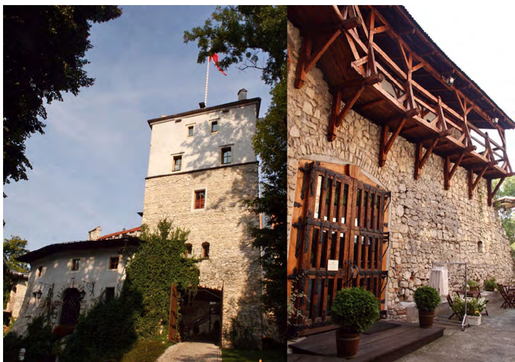
Ryc. 3. Zamek w Korzkwi – zrekonstruowana fasada z bramą wjazdową, dawne skrzydło mieszkalne i dziedziniec

Conference facilities predominate among the ways in which fortified manor houses have undergone conservation work for the aim of developing tourism. The manor