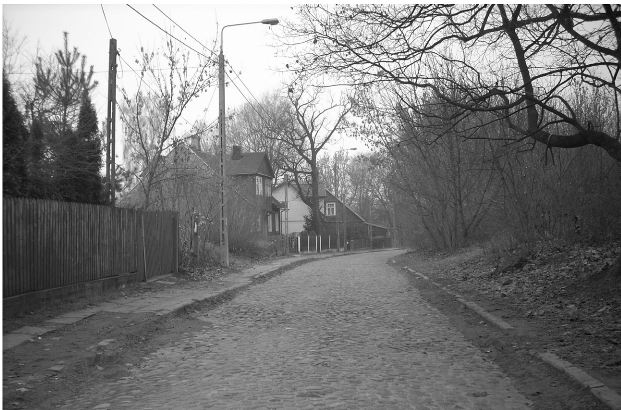
Ryc. 2 i 3. Wybrane widoki osiedla, stanowiącego przedmiot analizy; fot. autorka.