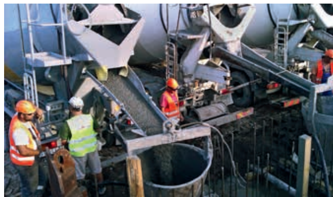
Betonowanie sekcji ścian szczelinowych

Realizacja obiektu odbywa się dwuetapowo. Pierwszy etap obejmuje wykonanie tzw. suchego wykopu, stanowiącego bazę do rozpoczęcia drugiego etapu – wznoszenia konstrukcji budynku.