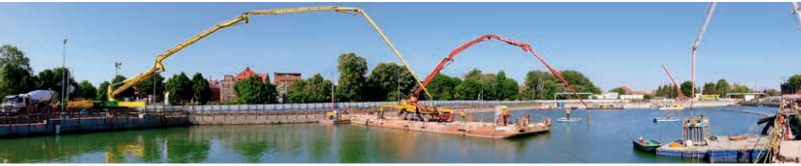
Widok budowy w trakcie betonowania korka podwodnego, fot. archiwum Soletanche Polska Sp. z o.o.

Mikropale zostały wykonane z jednostek pływających we współpracy z nurkami, a ich zadaniem jest tymczasowe zakotwienie korka betonowego oraz docelowe zakotwienie płyty fundamentowej budynku dla zrównoważenia wyporu wody;