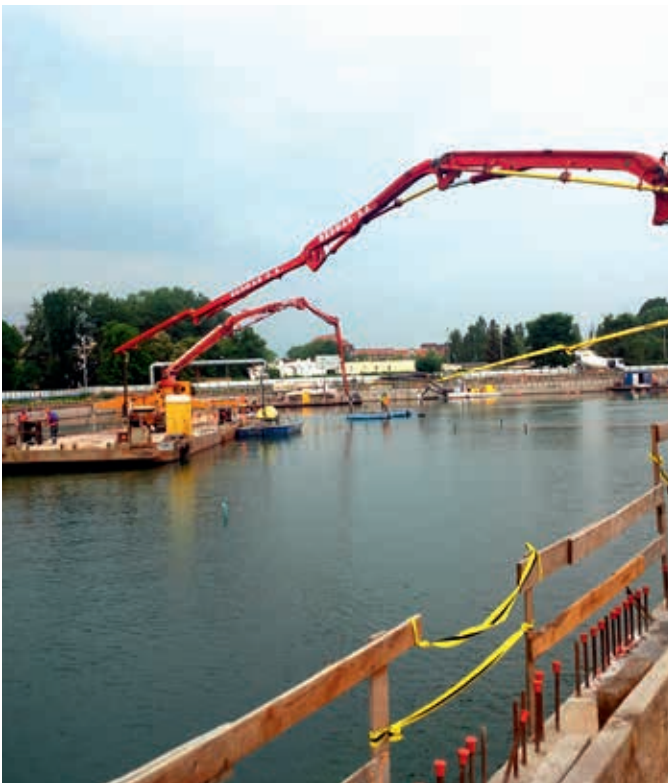
Widok na budowę – przepompowywanie betonu z pompy na brzegu do pompy na platformie pływającej

Korek betonowy wykonano metodą betonowania podwodnego w technologii opatentowanej Dobber®. W opisywanej technologii stalowe rury do betonowania podwodnego typu Contractor połączone są w górnej części z pływakiem, pozwalającym na utrzymywanie ich w pozycji pionowej. Do górnej części rur został zamontowany kosz zasypowy, przez który podawany był beton z pomp na początku betonowania. W kolejnej fazie kołnierz pompy do betonu został wprowadzony bezpośrednio do rury wlewowej.