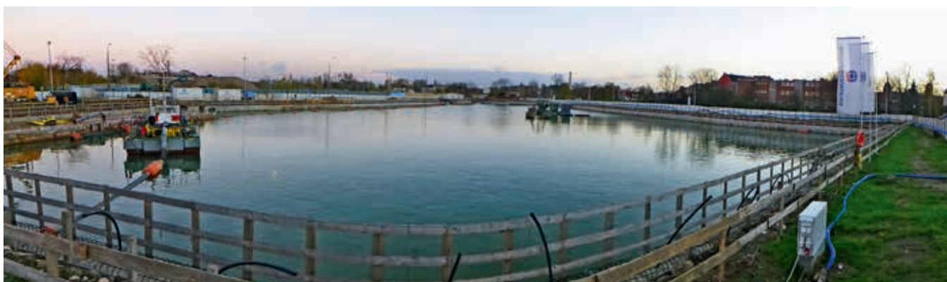
Widok budowy w trakcie wykonywania refulacji, fot. archiwum Soletanche Polska Sp. z o.o.