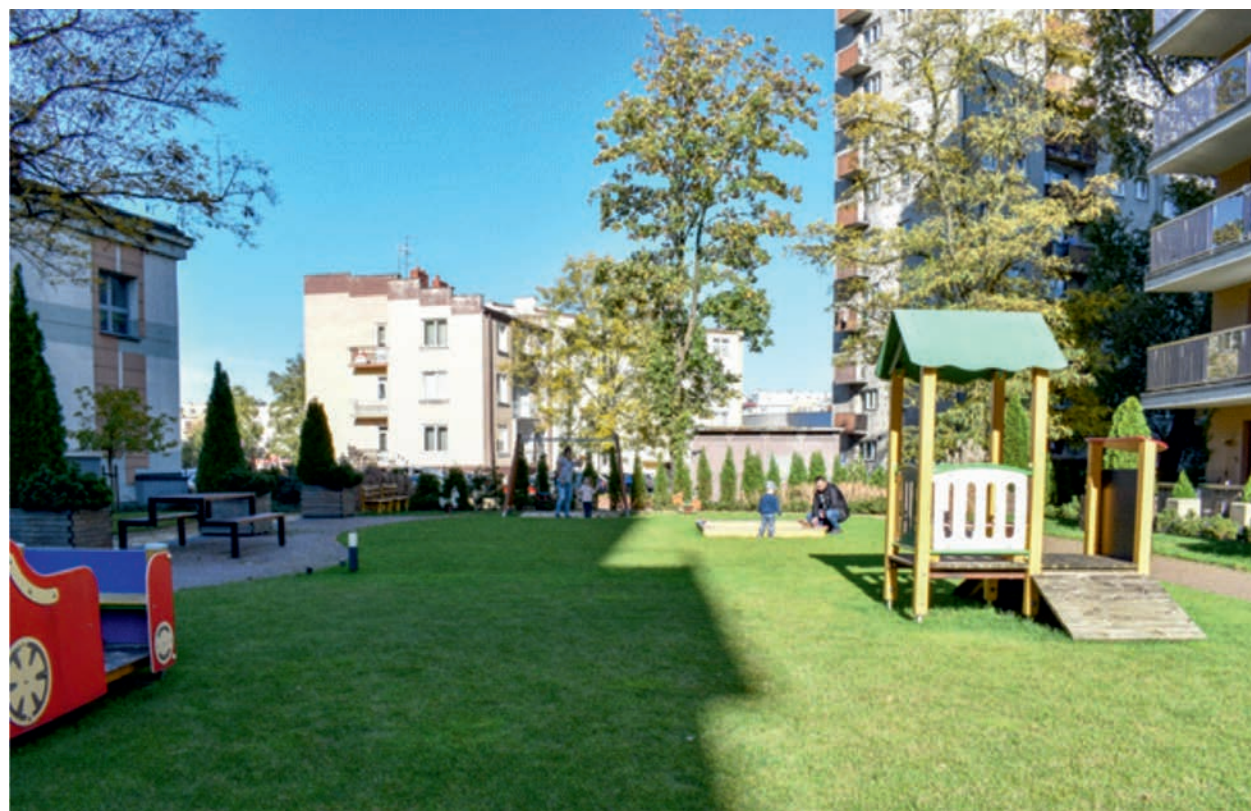
II. 4. Osiedle Parkowe. Kielce. Dziedziniec między budynkami III. 4. Parkowe housing estate. Kielce. Courtyard between the buildings

świadczą szlabany wjazdowe na teren osiedla, kod dostępu na dziedziniec, zamknięty plac zabaw, dobry stan techniczny urządzeń, zadbana zielen, ścieżki komunikacyjne oraz mała architektura. 80% przestrzeni społecznej jest terenem biologicznie czynnym. Uporządkowana i zadbana zielen w postaci krzewów, niskiej i wysokiej trawy ozdobnej i żywopłotu, zapewniają kontakt z elementami przyrodniczymi. Dziedziniec użytkowany jest całorocznie, o każdej porze dnia można zaobserwować, że ta przestrzeń społeczna służy rozwojowi bogatych form życia społecznego, od zabawy, po odpoczynek i rekreację, aktywizując i determinując kontakty społeczne i wzmacnianie więzi społecznych. Rozwiązania funkcjonalno-przestrzenne charakterystycznego osiedla w szczególności wyeksponowały przyjazne człowiekowi pod względem skali, proporcji i zagospodarowania terenu przestrzenie społeczne, jako miejsca dla kontaktów międzyludzkich i kontaktu z naturą. 3 Mimo, że zabudowa jest dosyć wysoka (11 kondygnacji), przez duży rozmiar działki (53 na 29 metrów), skala jest nadal ludzka.