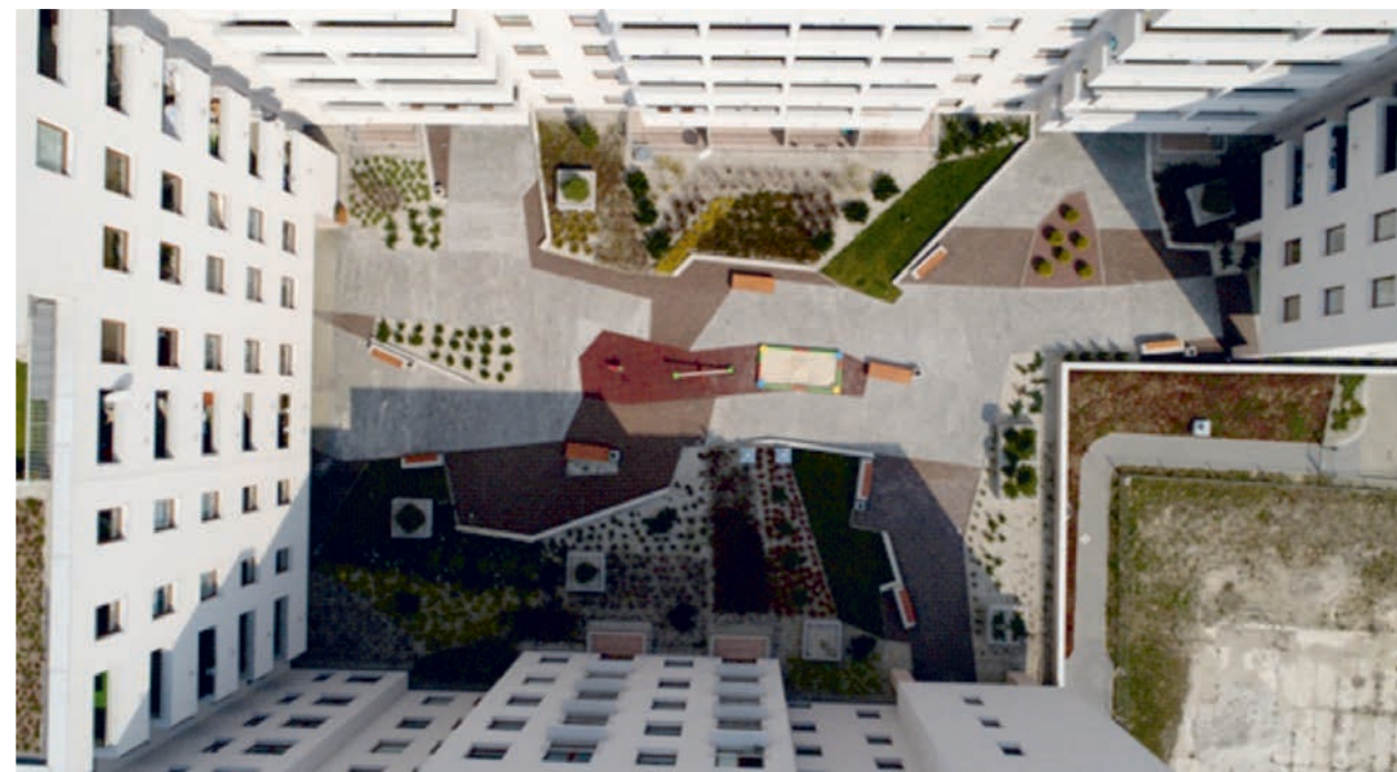
III. 7. Galene House housing estate. Kielce. Courtyard seen from the roof of the building