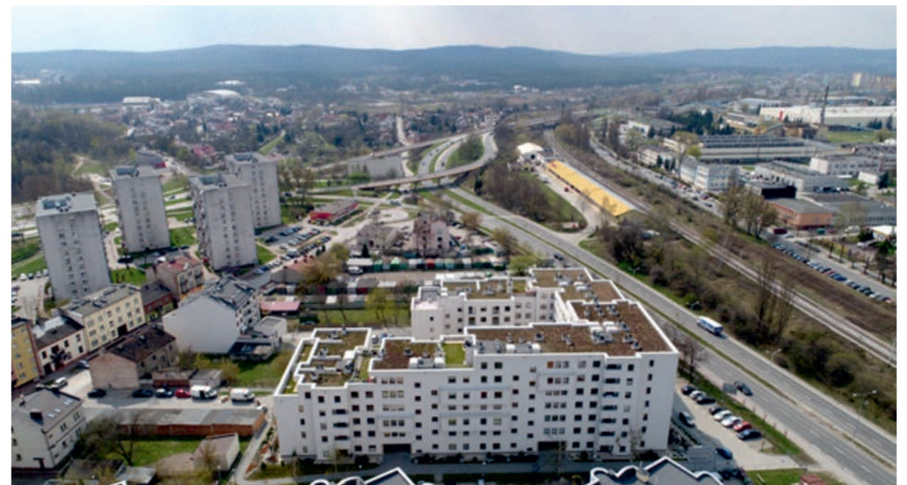
II. 5. Osiedle Galene House. Kielce. Zdjęcie z drona. III. 5. Galene House housing estate. Kielce. A photograph taken with a flying drone.

Autor projektu: RKO Pracownia Architektoniczna