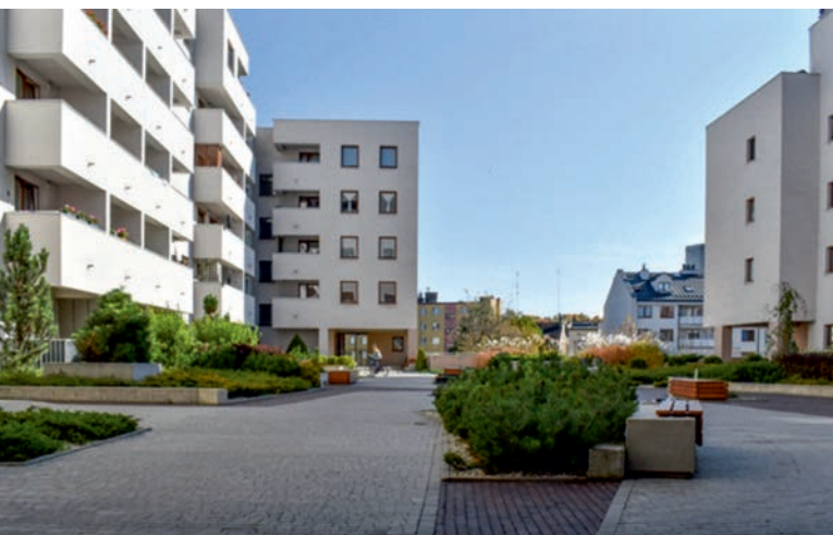
II. 10. Osiedle Galene House. Kielce. Dziedziniec między budynkami III. 10. Galene House housing estate. Kielce. Courtyard between the buildings