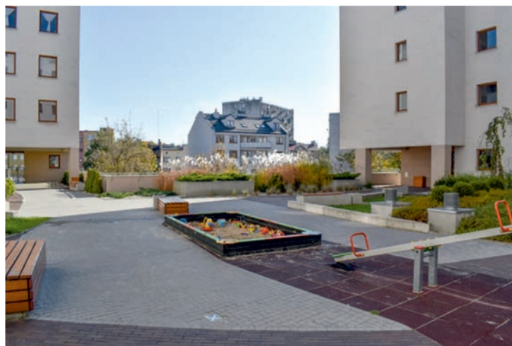
II. 11. Osiedle Galene House. Kielce. Dziedziniec między budynkami, fot. Małgorzata Wijas III. 11. Galene House housing estate. Kielce. Courtyard between the buildings, photo by Małgorzata Wijas

Aktywizuje różne formy życia mieszkańców, od spotkań, spacerów, rozmów i integracji. Dziedziniec – otwarty w kierunku południowo – wschodnim, dedykowany jest mieszkańcom, ale nie jest on jednocześnie niedostępny dla osób z zewnątrz. Jego przestrzeń określa zabudowa, został dodatkowo ogrodzony, a wejście na jego teren nie jest zabezpieczone kodem do bramy. Usytuowanie go pomiędzy zabudową w kształcie litery U bez wątpienia jednak wpływa na jego kameralność, stroni od hałasu, co wpływa na komfort spędzania tam czasu. Uporzędkowana i zadbana zieleń oraz dobry stan techniczny urządzeń i małej architektury, powiększają poczucie bezpieczeństwa. 7