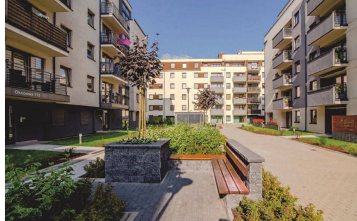
II. 12. Osiedle Jarzębinowe w Łodzi. Etap 1. Przestrzeń społeczna. Widok na dziedziniec między budynkami. III. 12. Jarzębinowe housing estate in Łódź. Step 1. Social space. View of the courtyard between the buildings.

Both buildings have 6 stories, and the complex is complemented by an internal courtyard, which communicates both buildings, as well as performs the function of social space for recreation. The seventh stage is currently under construction. 8 The author decided to describe the first stage due to certain social conditions, namely the need for residents to have a social zone on a larger scale than foreseen in the design assumption. The building's design