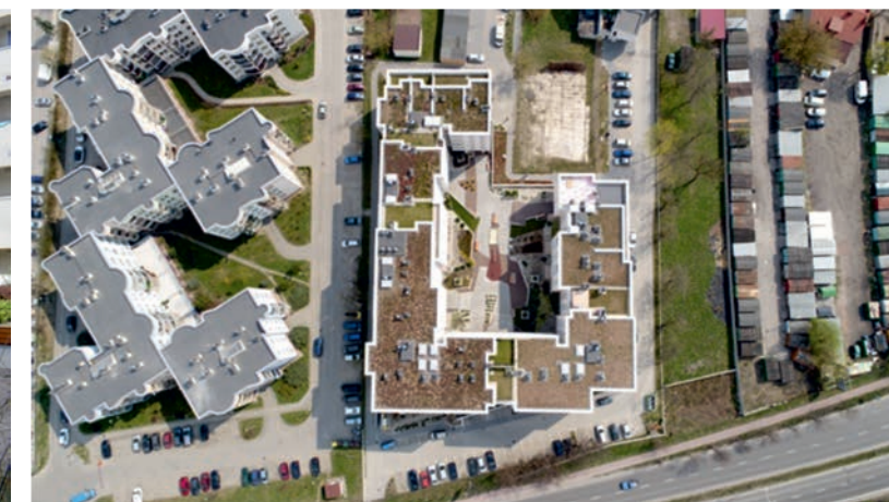
II. 8. Osiedle Galene House. Kielce. Dziedziniec między budynkami