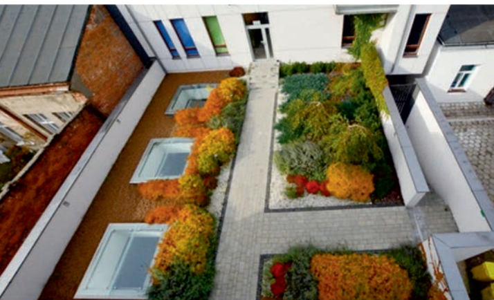
Il. 13. Budynek wielorodzinny Villa Vanilla. Kielce, wewnętrzny dziedziniec, odczyt z dn. 03.08.2019 Ill. 13. Villa Vanilla multi-family residential building, Kielce, inner courtyard, accessed on 03.08.2019