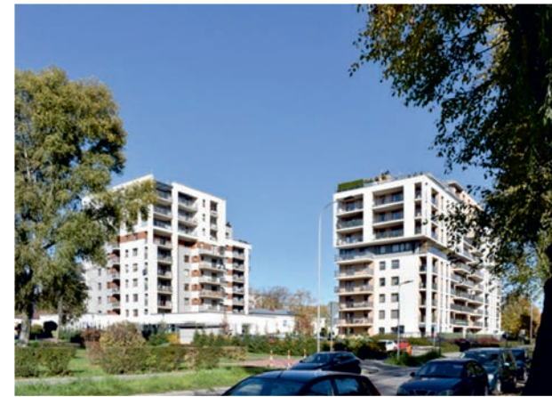
II. 1. Osiedle Parkowe. Kielce, ul. Biskupa Kaczmarka, fot. Małgorzata Wijas III. 1. Parkowe housing estate. Kielce, Biskupa Kaczmarka, photo by Małgorzata Wijas

Neighborhood: Skwer Harcerzy — green square, City Park, the Silnica River, Kadzielnia Nature Reserve, Castle Hill, playgrounds, bicycle path.