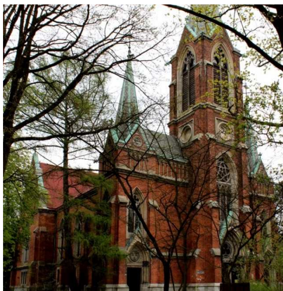
Rys. 4. Kościół Zbawiciela w Tomaszowie Mazowieckim – widok ogólny (fot. M. Zub)

Fig. 3 The Saviour's Church in Tomaszów Mazowiecki – plan (source: [7])