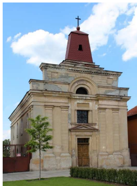
Rys. 2. Kościół św. Trójcy w Tomaszowie Mazowieckim – widok ogólny

Fig. 1. Church of the Holy Trinity in Tomaszów Mazowiecki – plan