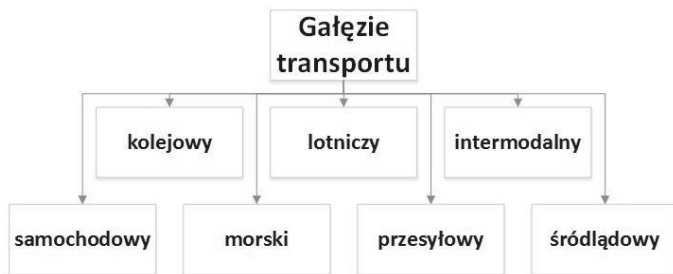
Rys. 1. Podział transportu na gałęzie