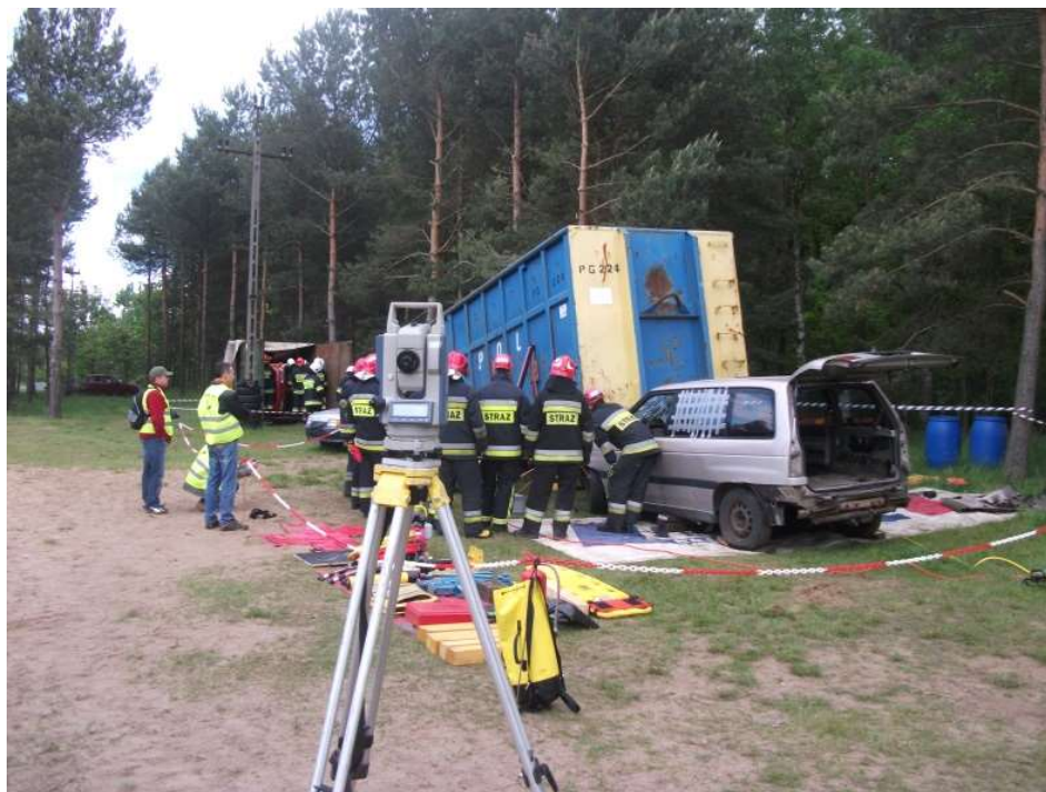
Fot. 4. Symulacja wcięcia pojazdu osobowego pod inny pojazd [Bąkowski 2015] Phot. 4. Simulation of the car collision [Bąkowski 2015]

W metodzie tej bardzo ważne jest doświadczenie osoby wybierającej punkty do badań. Podczas pomiarów symulowano wygięcie boczne - wzdłuż dłuższej linii boku, w środkowej części kontenera przy pomocy rozpieracza kolumnowego. Za miejsca prawdopodobnych odchyłek przyjęto krańce kontenera (Fot. 5.). Jednak przesunęły się one maksymalnie o 3 cm, natomiast w środkowej części kontenera, w miejscu przyłożenia siły, przemieszczenie wynosiło 12 cm. Taka wartość ma istotny wpływ na dalsze utrzymanie stateczności obiektu i może powodować jego przesunięcie, a końcowo utratę kontroli nad sytuacją. Trzeba pamiętać o tym, że żadna metoda pomiaru nie pokazuje nam rozkładu naprężeń, które powstają w wyniku działania sił na obiekt [Bąkowski 2015].