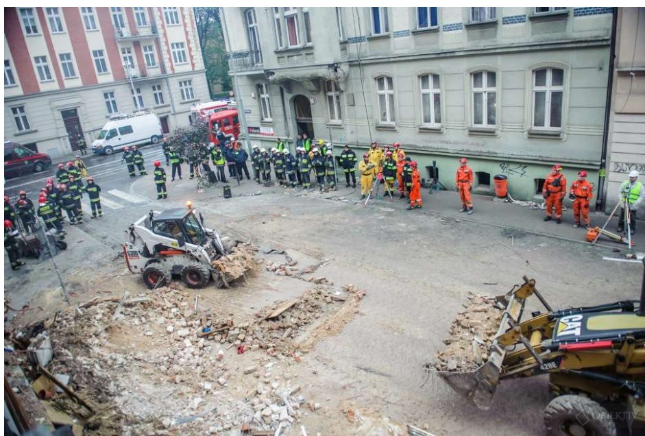
Fot. 2. Stanowiska obserwacyjne geodety oraz ratownika SGPR Phot. 2. Observation points of the geodetic surveyor and the USAR rescuer

Po dotarciu na miejsce SGPR z województwa małopolskiego zaczęto monitorowanie odchyłań ścian za pomocą teodolitu. Zabezpieczono również pozostałą konstrukcję kamienicy, która w każdej chwili mogła ulec zawaleniu. Ze względu na dużą ilość punktów wyznaczonych do obserwacji przybył Geodeta Powiatowy miasta Katowice wraz z tachimetrem z możliwością bezlustrowego pomiaru odległości, w celu pomocy w monitorowaniu gruzowiska. Punkty wyznaczone do obserwacji zostały podzielone pomiędzy geodetę a ratownika z SGPR (Fot. 2.).