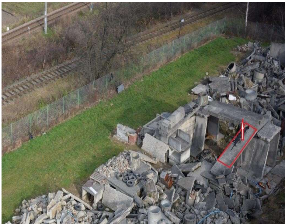
Fot. 7. Symulacja ruchu płyty [Leica 2014] Fot. 7. Plate displacement simulation [Leica 2014]

5 cm. Odstęp czasu pomiędzy kolejnymi sesjami pomiarowymi ustawiono na 2 minuty.