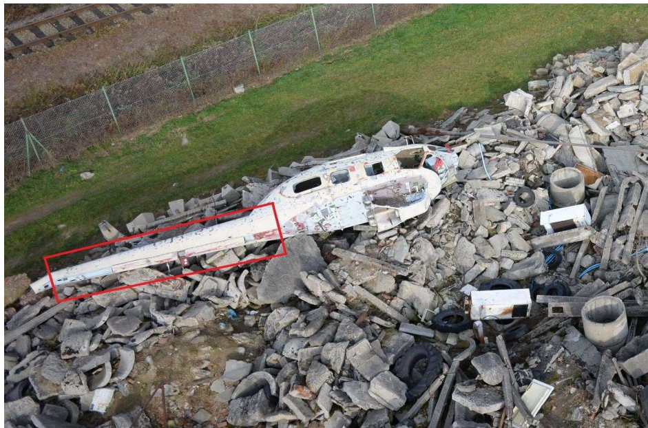
Fot. 9. Element kadłuba który podlegał pomiarom [Leica 2014] Phot. 9. A measured part of the helicopter hull [Leica 2014]