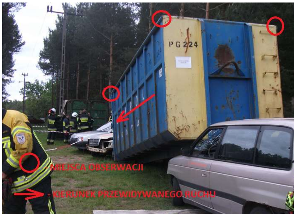
Fot. 5. Punkty obserwowane na kontenerze [Bąkowski 2015] Phot. 5. Observed points on the container [Bąkowski 2015]

laserowego, dając tym alternatywę do zastosowania podczas działań Państwowej Straży Pożarnej w Polsce.