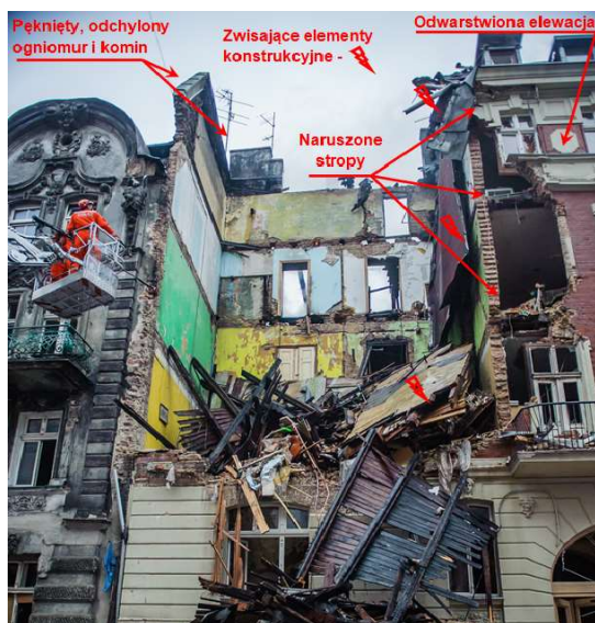
Fot. 1. Niestabilne elementy konstrukcyjne zawalonego w Katowicach budynku [Bąkowski 2015]

W październiku 2014 roku, w Katowicach, nastąpiła potężna eksplozja, która spowodowała zawalenie kamienicy przy ulicy Chopina 23 [Pieniżny 2014].