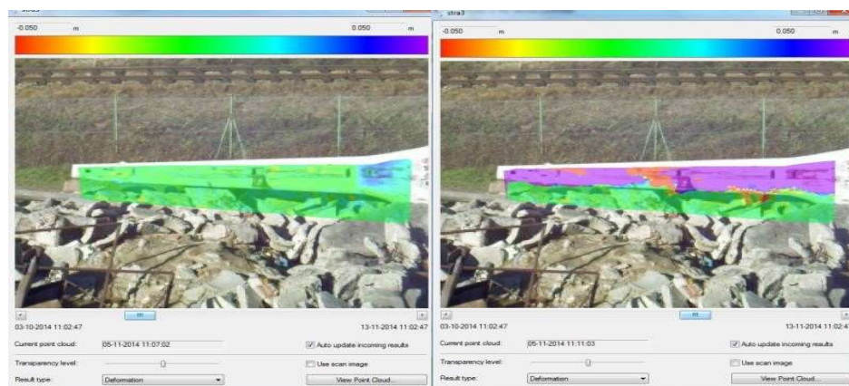
Fot. 10. Zmiany przemieszczeń ogona śmigłowca [Leica 2014] Phot. 10. Displacements of the helicopter tail [Leica 2014]

Na zrzutach ekranowych widać przemieszczenia obiektu, najpierw niewielkie, następnie duże, sięgające do 5 cm. Widać również pęknięcie w środkowej części ogona (Fot. 10.).