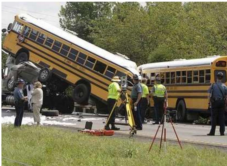
Fot. 3. Wypadek drogowy w Gray Summit

wykorzystywanym również w kryminalistyce. Tachimetrem elektronicznym obserwowali odległości do wytypowanych punktów na karoserii autobusu. W trakcie działań nie nastąpiły żadne przemieszczenia. Po usunięciu sprzętu ratowniczego, zeskanowano miejsce wypadku. Informacje te posłużyły Krajowej Radzie Bezpieczeństwa Ruchu Drogowego Komisji ds. bezpieczeństwa Transportu (National Transportation Safety Board) w ustaleniu przyczyn tego wypadku, w którym zginęły dwie osoby [National Transportation Safety Board 2011].