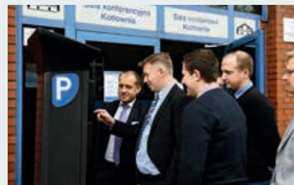
Uczestnicy konferencji testujący parkomat

W trakcie konferencji odbyły się dwie dyskusje plenarne. Pierwsza dotyczyła stref płatnego parkowania. Główne wątki podejmowane w trakcie dyskusji to ustawowe ustalenie maksymalnej opłaty za parkowanie, co utrudnia elastyczne kształtowanie opłat przez miasta, oraz kwestie regulacji prawnych dotyczących stref płatnego parkowania. Uczestnicy konferencji byli zgodni co do konieczności zmian w ustawach dotyczących stref płatnego parkowania. Druga dyskusja dotyczyła parkingów Park & Ride. Wątki podjęte w tej dyskusji dotyczyły wykorzystania samochodów w dojazdach do tego typu parkingów, co