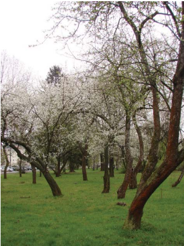
Il. 3. Stare drzewa owocowe — pozostałość po ogrodach działkowych. Park Pole Mokotowskie, Warszawa.

Ill. 3. Old fruit trees — a remnant of former allotment gardens. The Pole Mokotowskie Park, Warsaw.