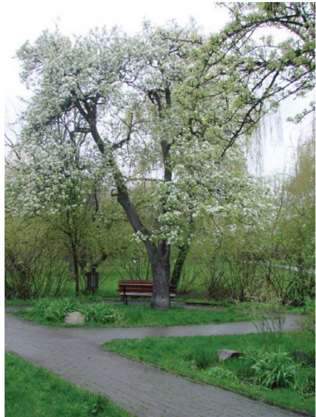
Il. 4. Miejsce z ławką przeznaczone do kameralnego odpoczynku, usytuowane pod starą jabłonią. Park Sady Żoliborskie, Warszawa.

Ill. 3. Old fruit trees — a remnant of former allotment gardens. The Pole Mokotowskie Park, Warsaw.