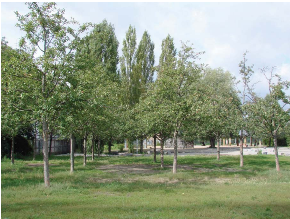
II. 6. Regularne nasadzenia drzew owocowych w nowo utworzonym sadzie. Mauerpark, Berlin (fot. K. Kimic, 2017).