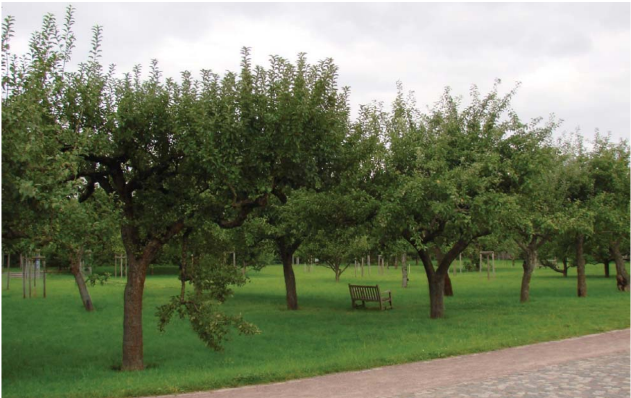
Il. 5. Ławeczki ustawione pod drzewami owocowymi w sadzie. Britzer Garten, Berlin.