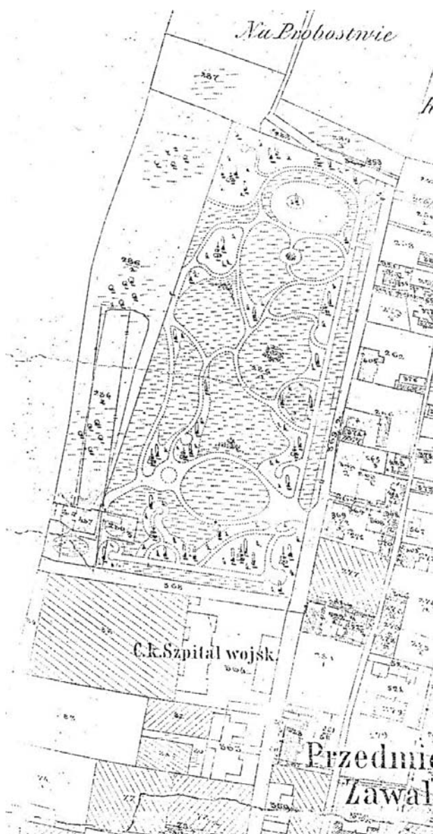
II. 2. Ogród Strzelecki w Tarnowie — plan katastralny z 1927 roku. Sad usytuowany w północno-zachodniej części parku odseparowany od jego części wypoczynkowej.

W podobny sposób zaprojektowano układ przestrzenny Ogrodu Strzeleckiego w Tarnowie, otwartego dla publiczności w 1869 roku (Potępa, 1979).