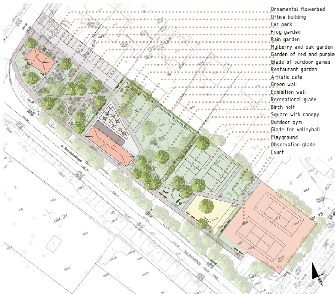
Fig. 3 Project of the park. Author of the drawing: J. Kosno Ryc. 3 Koncepcja zagospodarowania parku. Autor rysunku: J. Kosno