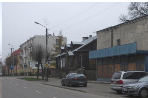
Fig. 6. Bielsk Podlaski. A wooden house (second half of the 19th c.) surrounded by contemporary building. Author: A. Owerczuk (2017)

Ryc. 5. Bielsk Podlaski. Dom drewniany (druga poł. XIX w.) znajdujący się w centrum miasta. Autor: A. Owerczuk (2017)