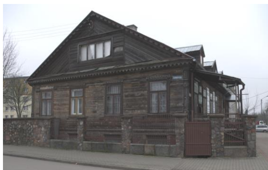
Fig. 5. Bielsk Podlaski. A wooden house (second half of the 19th c.) in the center of the town. Author: A. Owerczuk (2017)

“The monuments of architecture and construction in Poland. Białystok Voivodeship. T.3” was published [23]. It was one of the works within the series of publication. The register of objects placed there was the result of the action of historic resources recognition. Many buildings, which used to be neglected due to e.g. their relatively “young age”, were taken into account. Thus, a lot of objects from the second half of the 19 th and the beginning of the 20 th century can be found there. Obviously, it is not the register of immovable monuments, but during the time of working on publication, it is the authoritative source of information about the objects which are valuable from a conservation point of view. So, for instance, in Bielsk Podlaski 69 wooden houses were specified whereas there were only four bricked houses. This numerical data is worth analyzing as it proves that wooden building, specially wooden houses constituted quantitatively large stock of objects in the past. Perhaps, they are not particularly valuable in an official sense but definitely they are valuable witnesses of the past, reminding about the past character of a town building. In the neighborhood of modern land development, these old buildings appear to be relics of past eras (fig. 5, 6). They are situated in different parts of the town, and bear the record of old character of a town landscape.