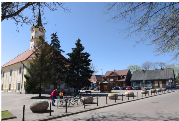
Fig. 4. Bielsk Podlaski. The town hall and the western frontage in the town hall square. Author: A. Owerczuk (2018)

Ryc. 3. Bielsk Podlaski. Ratusz. Autor: A. Owerczuk (2018)