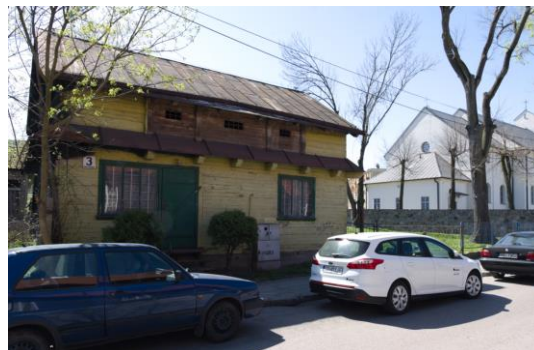
Fig. 11. Bielsk Podlaski. A wooden building in the center of the town. Kościelna St. Author: A. Owerczuk (2018)

Ryc. 10. Bielsk Podlaski. Domy drewniane w centrum miasta. Ul. Kościuszki. Autor: A. Owerczuk (2018)