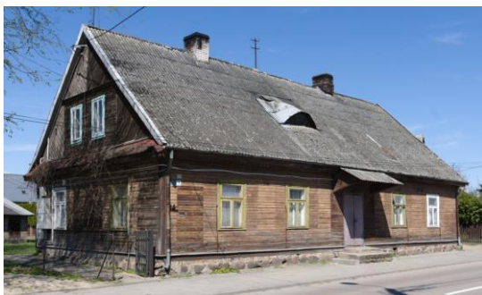
Fig. 12. Bielsk Podlaski. A wooden house. Mickiewicza St. Author: A. Owerczuk (2017)

Ryc. 11. Bielsk Podlaski. Budynek drewniany w centrum miasta. Ul. Kościelna. Autor: A. Owerczuk (2018)