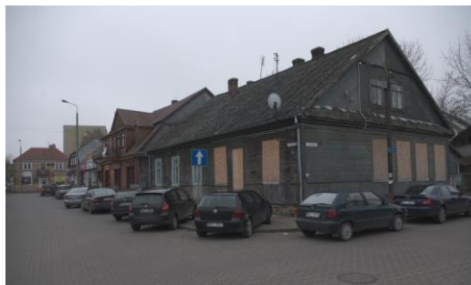
Fig. 9. Bielsk Podlaski. The western frontage in the town hall square. Author: A. Owerczuk (2017)

Ryc. 8. Bielsk Podlaski. Budynek przy Placu Ratuszowym. Autor: A. Owerczuk (2017)