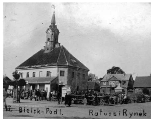
Fig. 2. Bielsk Podlaski. The town hall in the foreground. In the background a part of the western frontage in the town hall square is visible. Photo taken during inter-war period. Source: [26]

Ryc. 1. Bielsk Podlaski. Ul. Mickiewicza. Zdjęcie sprzed I wojny światowej. Dominuje zabudowa drewniana. W głębi widoczna wieża ratusza. Źródło: [25]