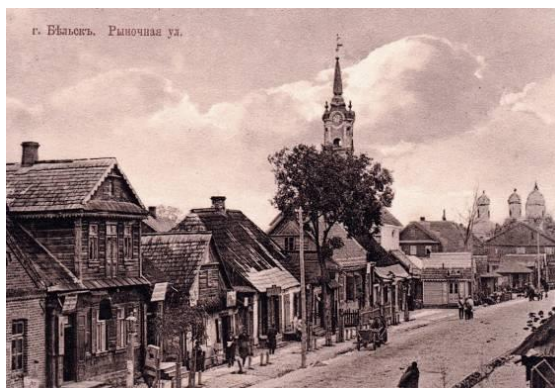
Fig. 1. Bielsk Podlaski. Mickiewicz St. The photo taken before the First World War. Wooden buildings dominate. In the background a tower of the town hall is visible. Source: [25]

Ryc. 1. Bielsk Podlaski. Ul. Mickiewicza. Zdjęcie sprzed I wojny światowej. Dominuje zabudowa drewniana. W głębi widoczna wieża ratusza. Źródło: [25]