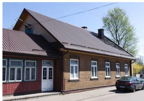
Fig. 13. Bielsk Podlaski. A wooden house. Ponia-towskiego St. Author: A. Owerczuk (2017)

Ryc. 12. Bielsk Podlaski. Dom drewniany. Ul. Mickiewicza. Autor: A. Owerczuk (2018)