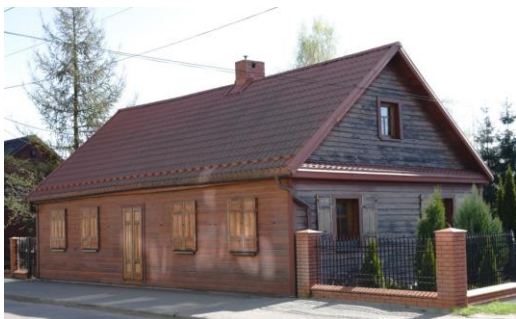
Fig. 14. Bielsk Podlaski. Jagiellońska St. A wooden house. Author: A. Owerczuk (2018)

Ryc. 13. Bielsk Podlaski. Dom drewniany. Ul Ponia-towskiego. Autor: A. Owerczuk (2018)