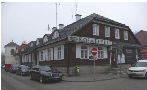
Fig. 8. Bielsk Podlaski. A building at the town hall square.

Ryc. 7. Bielsk Podlaski. Plac Ratuszowy wraz z najbliższym otoczeniem. 1) ratusz, 2) kościół. Opracował: A. Owerczuk