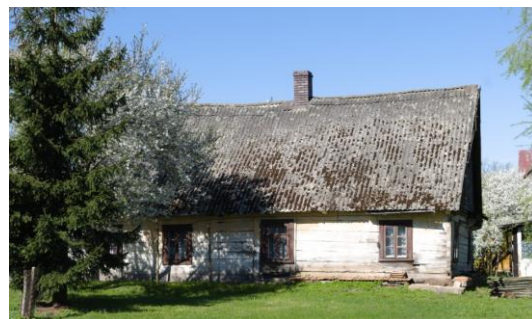
Fig. 15. Bielsk Podlaski. A wooden house. Kazimierzowska St.

Ryc. 14. Bielsk Podlaski. Ul. Jagiellońska. Dom drewniany.