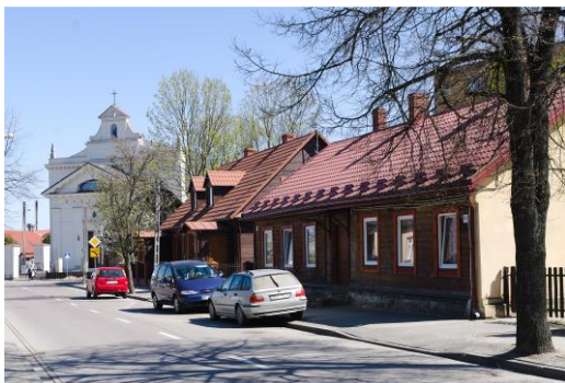
Fig. 10. Bielsk Podlaski. Wooden houses in the center of the town. Kościuszki St. Author: A. Owerczuk (2018)

Ryc. 10. Bielsk Podlaski. Domy drewniane w centrum miasta. Ul. Kościuszki. Autor: A. Owerczuk (2018)