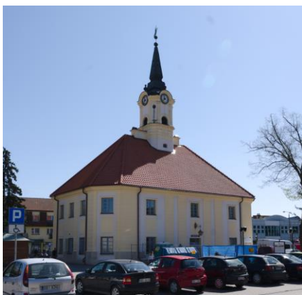
Fig. 3. Bielsk Podlaski. The town hall. Author: A. Owerczuk (2018)

well as improved fire safety. Gentry mansions were similar in forms to town houses and cottages. Besides the center, there was a dispersed construction among gardens. Lower housing density and the character change of the building outside the centre was common in small towns in Poland [2, s. 86]. Straw was also used to cover the roofs [3, p. 2]. Jewish community, which contributed to the appearance and character of the town, must be mentioned here. It was a numerous group in the eastern towns. In 1878 there were 5810 inhabitants in Bielsk, among whom about two thirds were Israelites.[16, p. 215]. A former wooden railway station should be indicated as one of the most important architectural objects. It was erected as a part of developing infrastructure of railroad line Kiev- Brest – Bielsk – Białystok – Königsberg (1873) at the end of the 19 th century with a later expansion of a section to Białowieża (1894) [14, p. 17]. During the First World War the railway station was destroyed. In this place, during inter-war period, a new, bricked station was raised. At the end of the 19 th century, Bielsk had almost 8 thousand inhabitants and 675 houses, but only 16 brick-built houses [11].