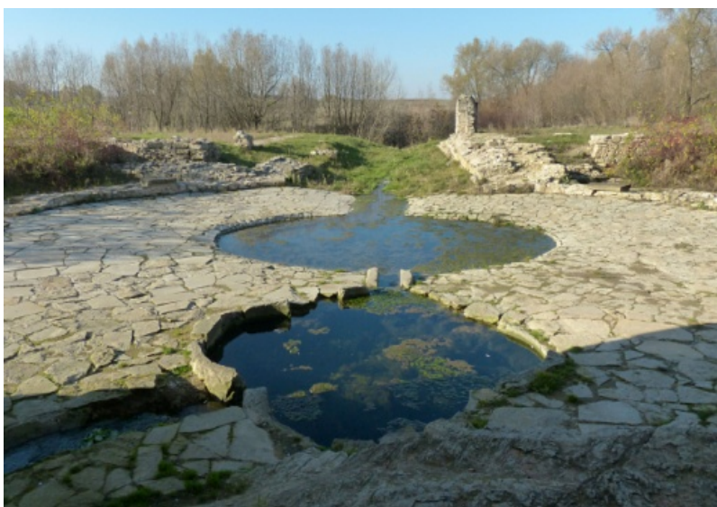
Fig. 4. Elements of the small architecture of the garden and the water intake in front of the rampart of the 8-sided tower (uncovered in the course of archaeological excavations)

In the next part of his letter, the author confused Opaliński with Ossoliński (!), diminished the role of the research and reconstruction works that had been carried out under the supervision of Professor Alfred Majewski and suggested that the reconstruction of the castle, i.e. “liquidation of the ruins”, would evidently falsify the foregoing historical evidence... He finished by asking a shocking question, namely if the conservation of historical monuments was supposed to accept their falsification or rather preserve their authenticity, regardless of their current condition. To sum up, a representative of the government regarded starting the debate on changing the doctrine behind the conservation and restoration of monuments and sites as inappropriate.