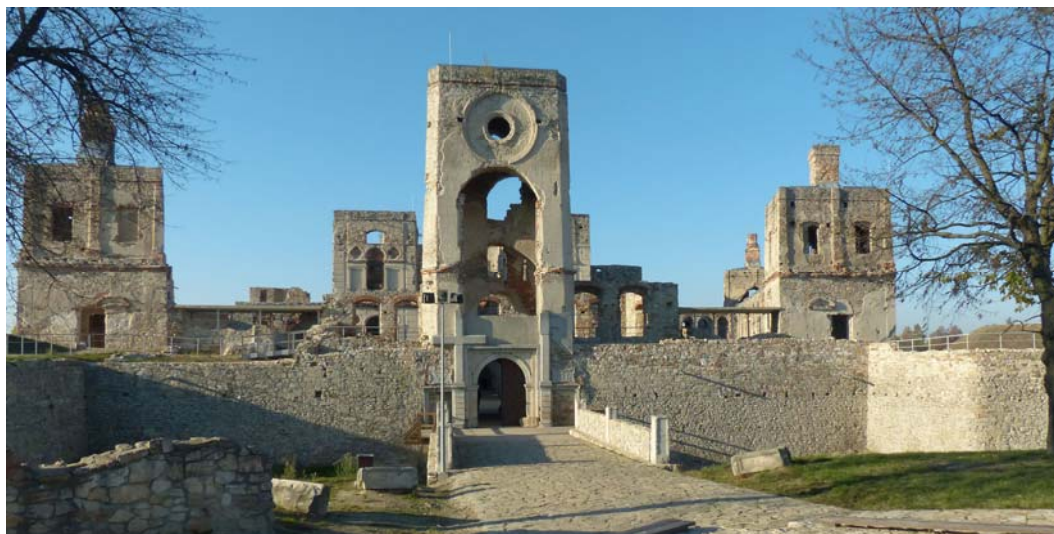
Fig. 7. The front (southern) elevation of the castle. Ryc. 7. Elewacja frontowa (południowa zamku).

In order to implement this optimistic vision, it is necessary to: