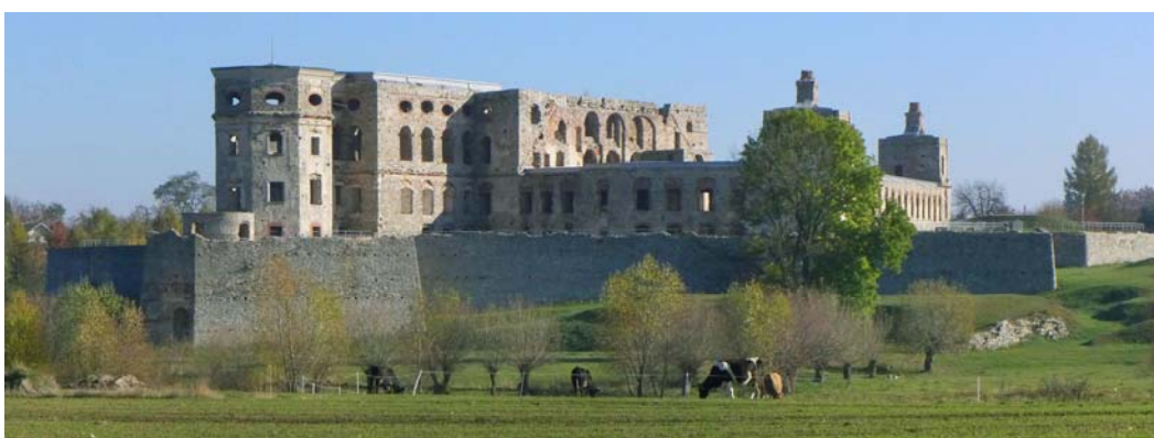
Fig.8. A view of the castle from the north-west.

Thus, the only issue to be considered by specialists is if the application for inclusion should be submitted right now, or maybe when the structural members and decorative elements whose forms and material structure are known have been recreated.