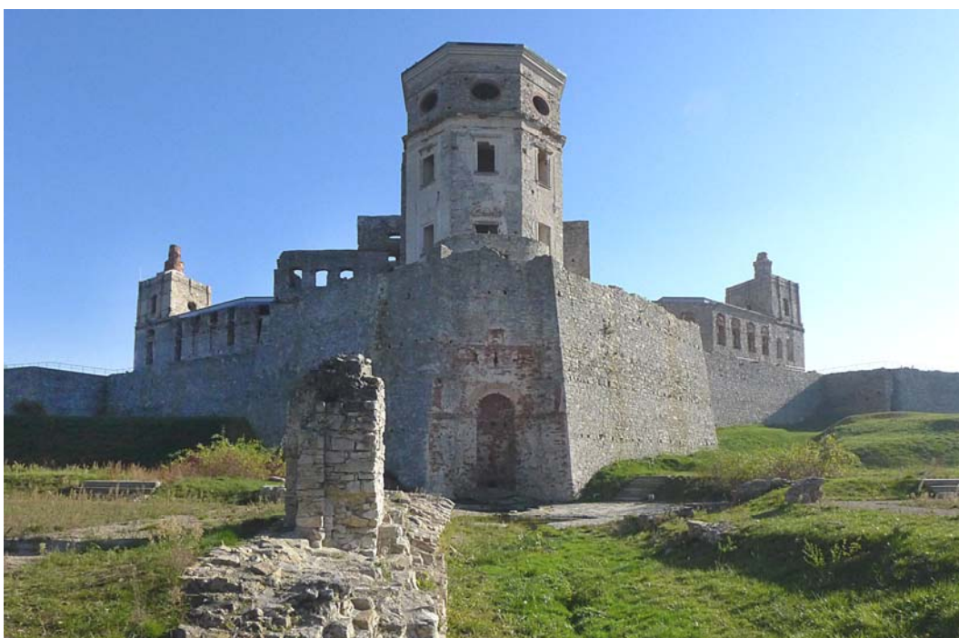
Fig. 9. The north elevation of the castle with uncovered architectural elements of the former garden

Ryc. 8. Widok zamku od północnego-zachodu.