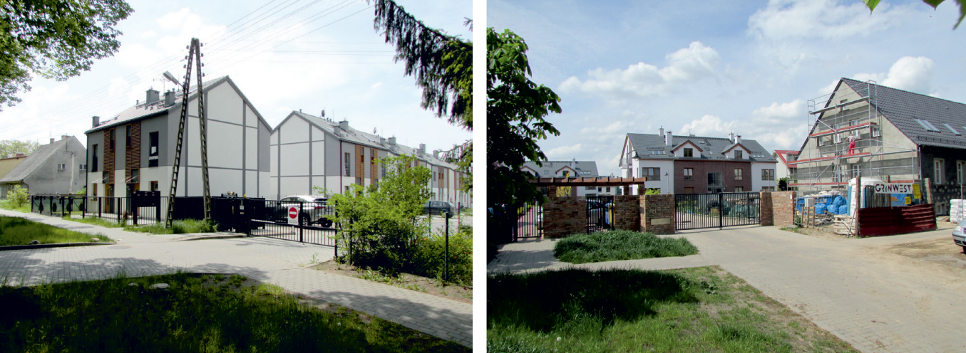
il. 8. Widok zespołu mieszkaniowego przy ulicy Bukietowej (nowoutworzonej ulicy wewnętrznej, prostopadłej do ulicy Szerokiej). Architektura „w sposób graficzny” próbuje nawiązać do rysunku elewacyjnego charakterystycznego dla konstrukcji słupowo-ryglowej. ill. 8. View of the residential complex at Bukietowa Street (recently established internal street, perpendicular to Szeroka Street). The architecture “graphically” tries to refer to the façade drawing characteristic for the mullion-transom structure.