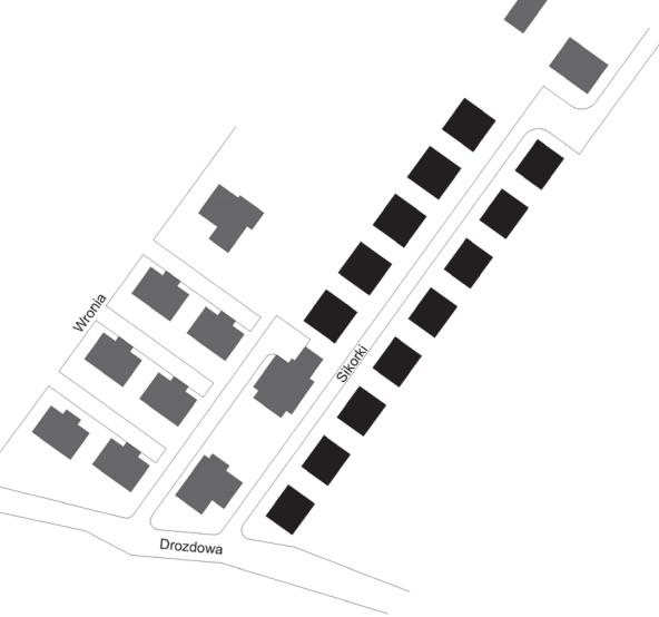
il. 5. Schemat kompozycji urbanistycznej zespołu przy ulicy Sikorki w Szczecinie (projekt Urbicon sp. z o.o.). ill. 5. Scheme of urban composition of the complex at Sikorki Street in Szczecin (project Urbicon sp. z o.o.).