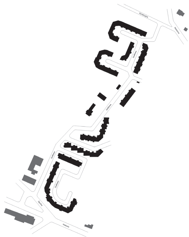
il. 1. Schemat kompozycji urbanistycznej zabudowy wielorodzinnej we wsi Mierzyn (Möhringen) w gminie Dobra przy ulicy Granitowej. Przykład zespołu powstałego na przełomie XX i XXI w. w pobliżu drogi krajowej nr 10 i przejścia granicznego w Lubieszynie. W momencie powstawania zespołu na byłych gruntach rolnych kontekst przestrzenny stanowiła zabudowa gospodarcza wsi, oraz budynki nieistniejącego PGR. Obecnie wokół osiedla powstały nowe założenia mieszkaniowe, oraz budynki produkcyjne.