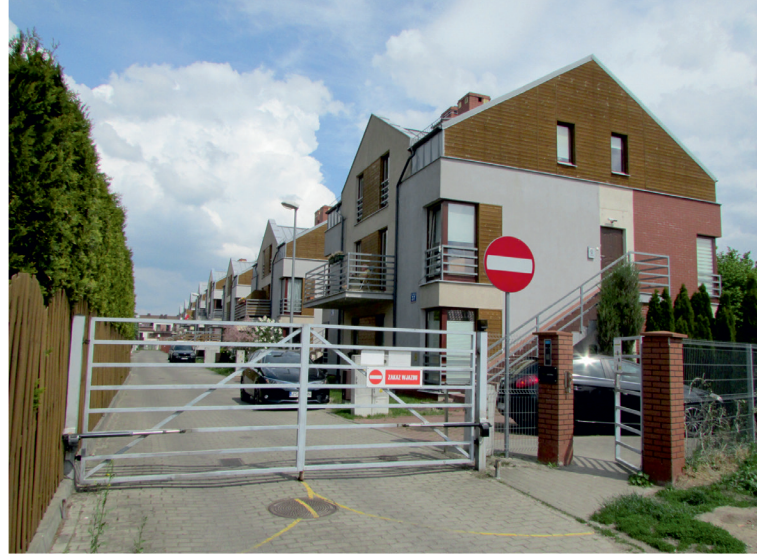
il. 6. Wjazd do zespołu przy ulicy Sikorki w Szczecinie (projekt: Urbicon sp. z o.o.). Zespół podobnie jak i znaczna część sąsiednich osiedli jest zamknięty dla osób postronnych. ill. 6. Entrance to the complex at Sikorki Street in Szczecin (project: Urbicon sp. z o.o.). The complex, as well as a large part of the neighboring settlements, is closed to the public.

był przez jako tereny rolne. Procesy urbanizacyjne, związane z realizacjami nowych budynków jednorodzinnych, rozpoczęły się tu już w latach 80. XX w. Atrakcyjność lokalizacji, a przede wszystkim jej walory komunikacyjne spowodowały, że w latach 90. XX w. zaczęły powstawać tam budynki wielorodzinne. Przykładem reprezentującym rozwiązania z tamtego okresu może być zespół przy ul. Korolowej 82-100 (il. 2). Budynki w układzie klatkowym, z trzema kondygnacjami mieszkalnymi i wysokim dachem, reprezentują pod względem stylistycznym cechy charakterystyczne dla ówczesnych polskich poszukiwań inspirowanych geometrycznym postmodernizmem.