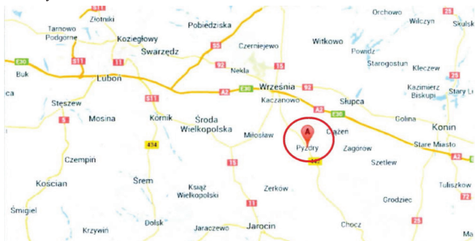
Rysunek 1. Lokalizacja omawianego obiektu (maps.google.pl).

Celem pracy jest ocena wpływu nawadniania podkoronowego na plonowanie jabłoni odmiany Fuji Kiku. w trzecim roku owocowania w okresie wegetacyjnym w 2014 roku w miejscowości Pызdry (rys.1.). Sad założono w prywatnym gospodarstwie sadowniczym w 2011 roku na obszarze 1 ha w rozstawie między rzędami 3,5 metra i 1 metr pomiędzy drzewami w rzędzie. Ilość drzew na kwaterze wynosiła 2800 sztuk. Drzewka szczepione były na podkładkach karłowatych M9.