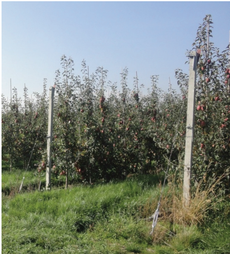
Fotografia 1. Drzewka odmiany Fuji Kiku Photo 1. Trees – Fuji Kiku

produkowane przez Firmy Irriga, o maksymalnym wydatku 63 \text{ lh}^{-1} i zasięgu do 3-3,5 m. Obliczone największe zapotrzebowanie na wodę wynosiło 25 \text{ m}^3 \cdot \text{h}^{-1} . Ze względu na wydajność pompy przyjęto wydajność zraszaczy na poziomie 30 \text{ lh}^{-1} i rozstawę 3 m między zraszaczami po 1,5 m zasięgu z każdej strony.