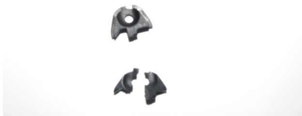
Ryc. 5. Zaślepka uszkodzona w trakcie zdarzenia oraz zaślepka nieuszkodzona.

Do badań kryminalistycznych przekazano wszystkie zabezpieczone na miejscu zdarzenia części składowe broni. Były to: uszkodzony pistolet, bijnik (mechanizm igliczny), dźwignia zwalniania iglicy oraz dwa fragmenty tylnej plastikowej zaślepki zamka.