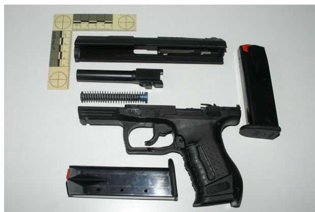
Ryc. 2. Pistolet WALTHER P99 kal. 9 mm w stanie częściowo rozłożonym.