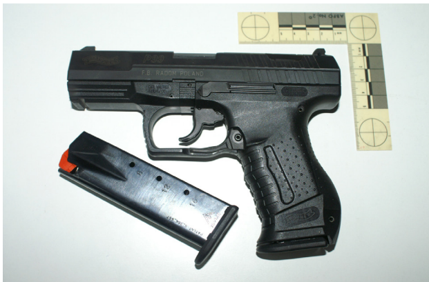
Ryc. 1. Widok boczny pistoletu WALTHER P99 kal. 9 mm.

Pistolet WALTHER P99 kal. 9 mm został skonstruowany i wyprodukowany przez niemiecką firmę WALTHER. Od 2001 roku broń ta znajduje się na wyposażeniu polskiej Policji. Pistolety WALTHER P99 kal. 9 mm od 2001 roku są wytwarzane w Zakładach Mechanicznych „ŁUCZNIK” (obecnie Fabryka Broni „ŁUCZNIK” w Radomiu Sp. z o.o.). Pistolet WALTHER P99 jest bronią bezkurkową, samopowtarzalną, działającą na zasadzie wykorzystania energii krótkiego odrzutu lufy. Pistolet ma wskaźnik napięcia iglicy oraz wskaźnik obecności naboju w komorze naboju. Pistolet WALTHER P99 ma kilkustopniowy system zabezpieczeń: blokadę iglicy, bezpiecznik spustowy, bezpiecznik przed przypadkowym strzałem oraz przycisk zwalniania iglicy. Powyższe zabezpieczenia pozwalają nosić broń z nabojem załadowanym do komory naboju. Dodatkowym zabezpieczeniem broni jest zastosowanie tzw. antystresowego mechanizmu spustowego. Usunięcie powyższego zabezpieczenia wymaga ściągnięcia spustu na drodze 9 mm.