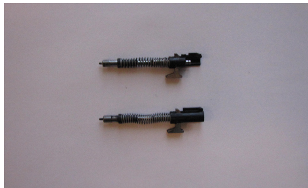
Ryc. 6. Uszkodzony bijnik zabezpieczony na miejscu zdarzenia oraz bijnik nieuszkodzony.