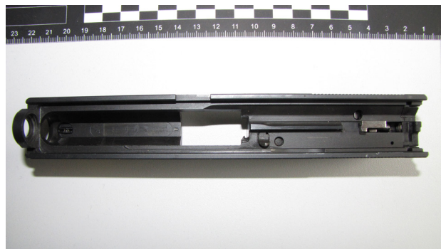
Ryc. 3. Widok dolnej części zamka pistoletu WALTHER P99 kal. 9 mm.

W ostatnim czasie w Centrum Szkolenia Policji w Legionowie miało miejsce zdarzenie, które rzuciło niekorzystne światło na bezpieczeństwo użytkowania wyżej wymienionej broni. W trakcie szkolenia funkcjo-