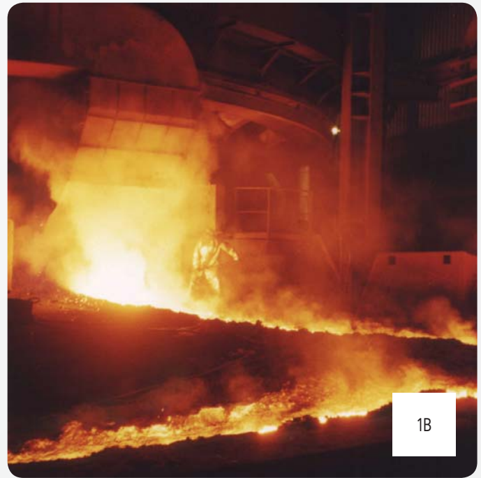
Fot. 1. Spust surówki z wielkiego pieca; pierwszy garowy, w kombinezonie z materiału metalizowanego, wykonuje typowe czynności podczas spustu surówki; temperatura surówki wynosi 1430-1480 °C, 1A – z bliższej i 1B – z dalszej perspektywy

Photo 1. Pig-iron triggered from a huge furnace; steelworker in overalls made of metalized material, performing routine activities during the triggering, pig-iron's temperature : 1430-1480 °C, 1A – at close quarters and 1B – in perspective (own source)