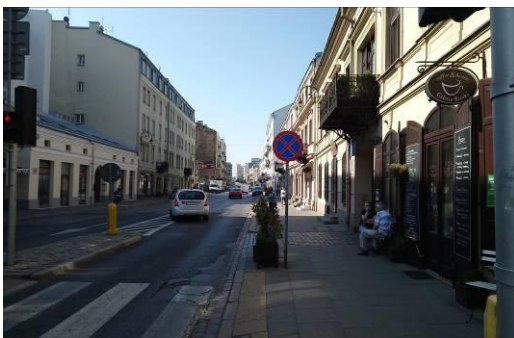
Fig. 3. Żabkowska Street.

Ryc. 3. ul. Żabkowska, X 2018.