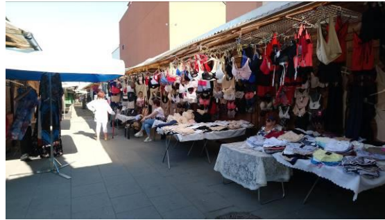
Fig. 2. Bazar Różyckiego Source: E. Jarecka – Bidzińska Ryc. 2. Bazar Różyckiego, X 2018. Źródło: E. Jarecka - Bidzińska]