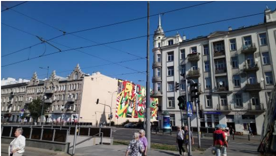
Fig. 1. Targowa Street. Ryc. 1. skrzyżowanie ul. Żąbkowskiej z ul. Targową oraz przejście dla pieszych w kierunku Bazaru Różyckiego, X 2018.