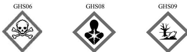
Rys. 1. Kody hasła ostrzegawczego: „Niebezpieczeństwo”. Piktogramy określone w rozporządzeniu WE nr 1272/2008 (CLP) mają czarny symbol na białym tle z czerwonym obramowaniem, na tyle szerokim, aby było wyraźnie widoczne

Ponieważ do dnia 1.06.2015 r. istnieje prawny obowiązek jednoczesnego podawania klasyfikacji substancji wg dotychczasowych zasad i kryteriów – poniżej podano klasyfikację 1,2-dibromoetanu zamieszczoną w tabeli 3.2. załącznika VI do rozporządzenia WE nr 1907/2006):