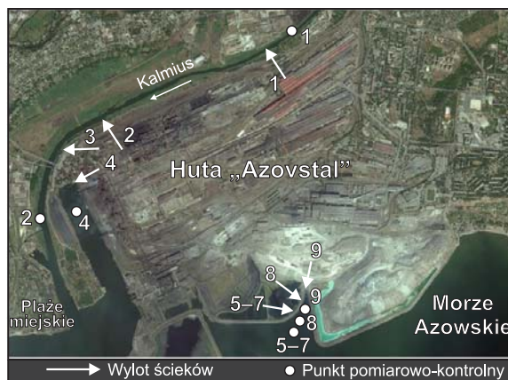
Rys. 1. Miejsca odprowadzania ścieków z huty „Azovstal” w Mariupolu oraz odpowiednie punkty pomiarowo-kontrolne Fig. 1. Wastewater discharge points for the Azovstal Iron & Steel Works in Mariupol and the corresponding measurement points

Powierzchnia zajmowana przez hutę „Azovstal” w Mariupolu wynosi około 1112 ha, co stanowi ponad 7% całkowitej powierzchni miasta. Zakład ma rozwiniętą infrastrukturę techniczną, w tym własny port morski, specjalizujący się w załadunku i transporcie wielkowymiarowej stali płytowej, wyrobów metalowych, a także kruszywa z żużla. Podstawowym źródłem wody pobieranej przez hutę do celów technologicznych jest Morze Azowskie, przy czym woda morska jest zużywana głównie w procesach chłodzenia. Ścieki powstające w procesach technologicznych i zużyte wody chłodnicze są odprowadzane przez sześć wylotów (4–9) do strefy przybrzeżnej Morza Azowskiego oraz przez trzy wyloty (1–3) do rzeki Kalmius (rys. 1). Kategorię ścieków odprowadzanych z terenu huty i ich ilość przedstawiono w tabeli 7.